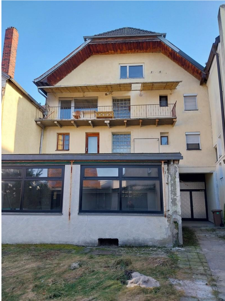
Rückansicht vom Innenhof