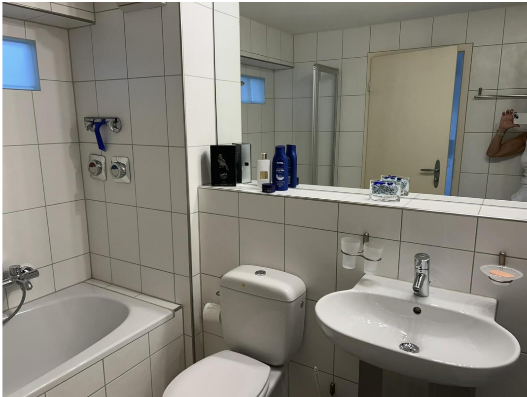
Badewanne, WC und Waschbecken