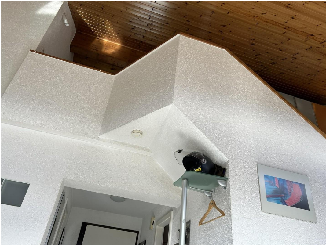
Aufblick von Balkon zu Galerie