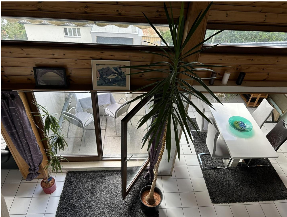
Sicht von Galerie - Balkon