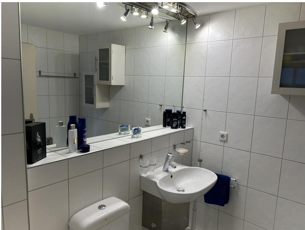
Waschbecken und Badspiegel