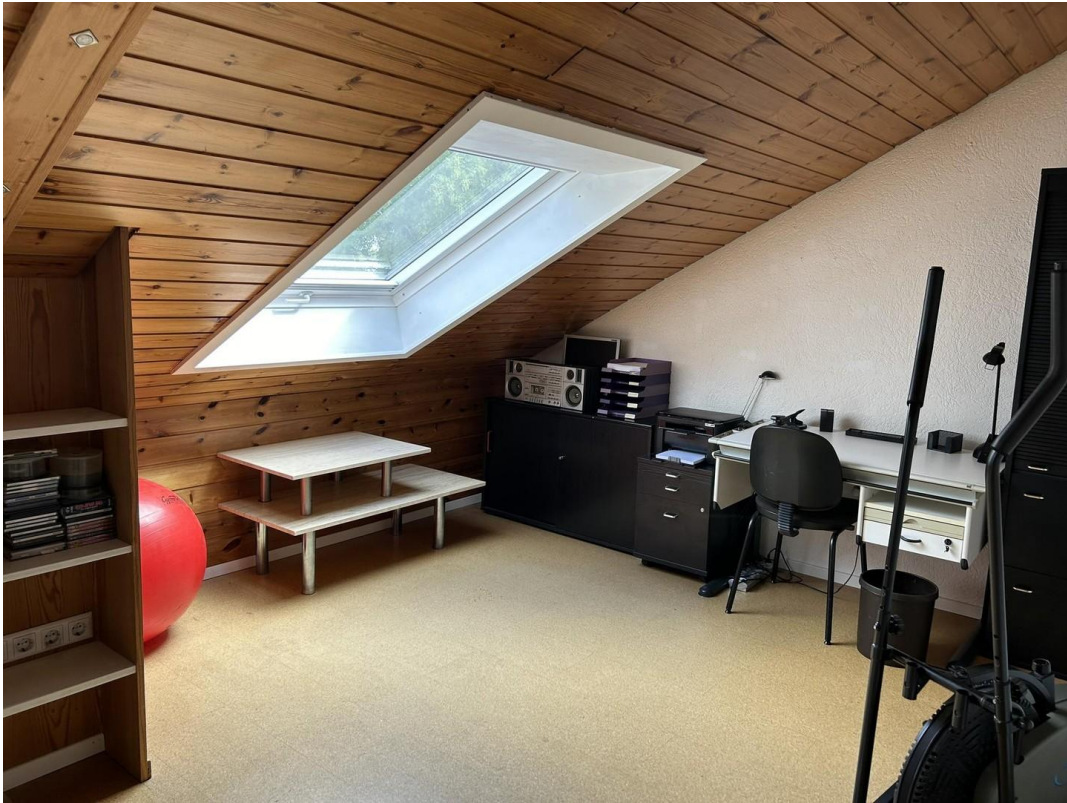
Büro 2. Stockwerk