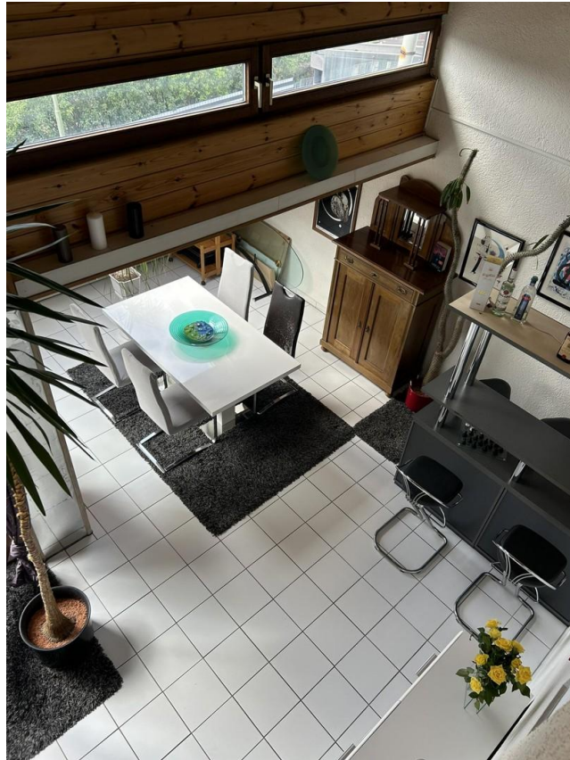
Sicht von Galerie - Esszimmer