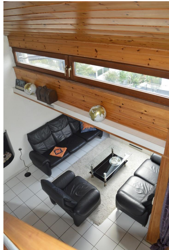
Sicht von Galerie - Wohnzimmer