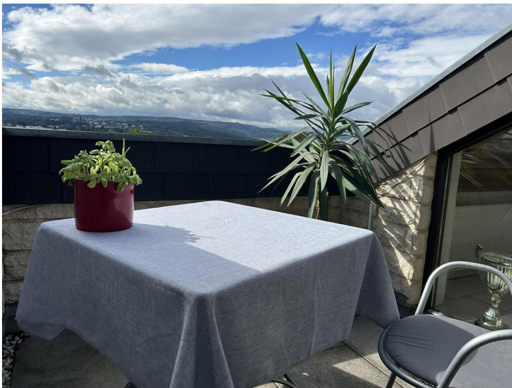
Sitzgelegenheit auf dem Balkon