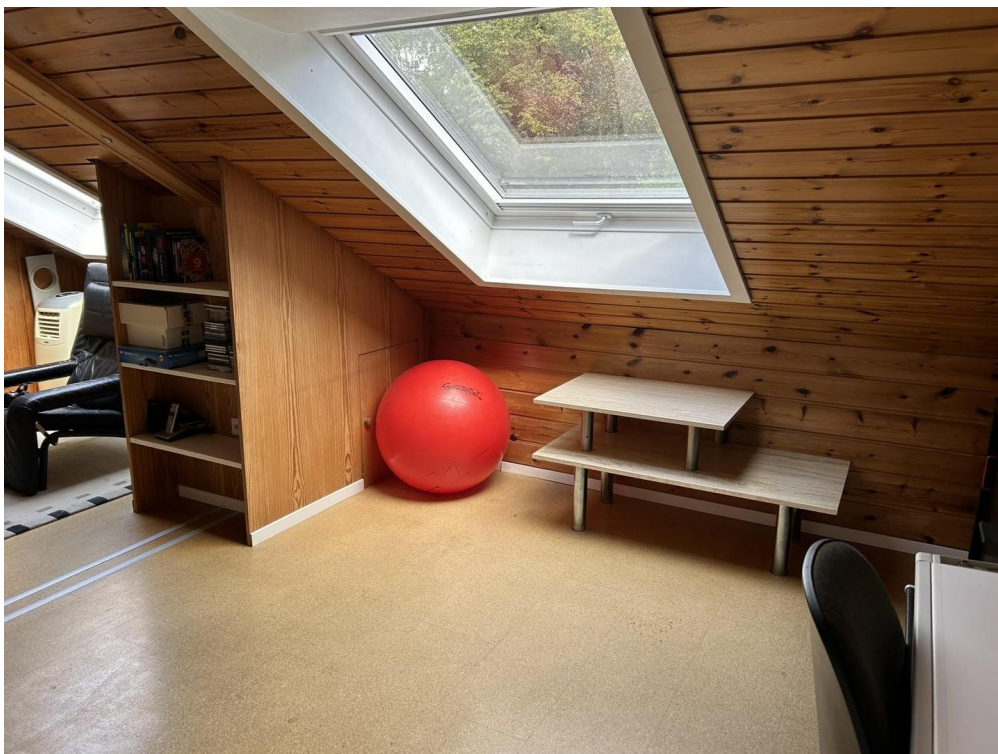
Dachfenster Büro 2. Stockwerk