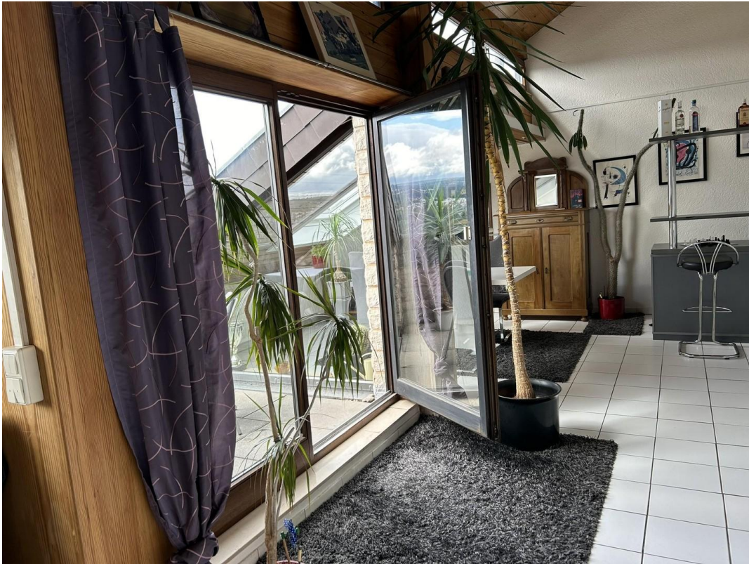
Einblick über Balkon