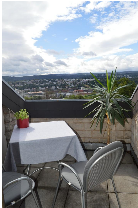
Sitzgelegenheit auf dem Balkon