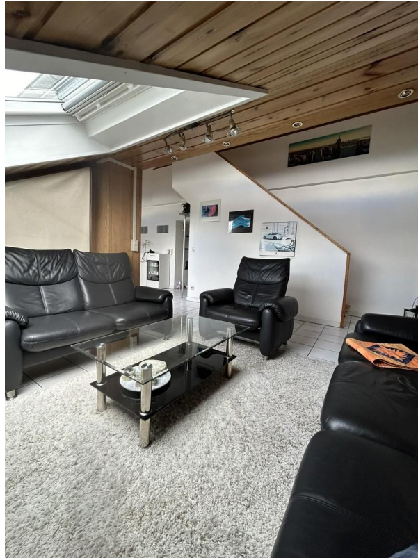
Sicht von Wohnzimmer in Flur