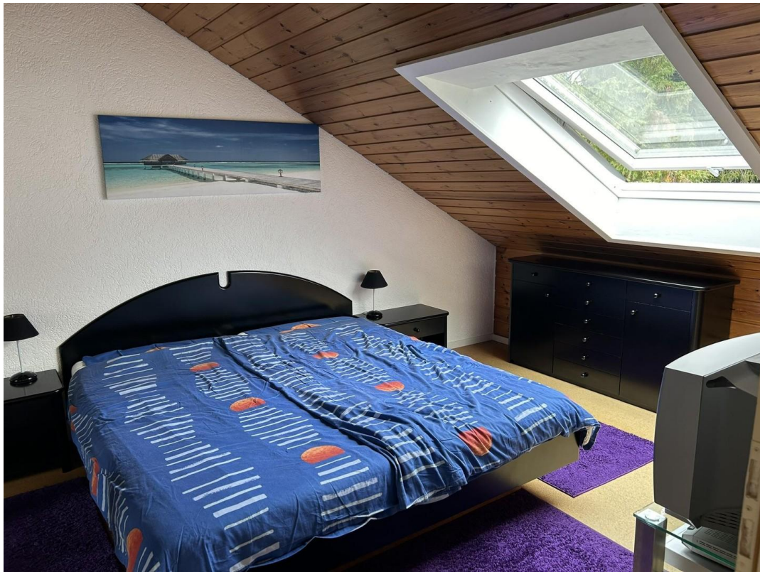
zur Villengegend gerichtet