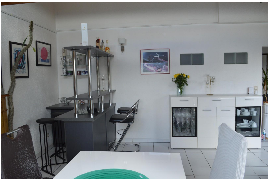
Sicht von Essbereich auf Bar