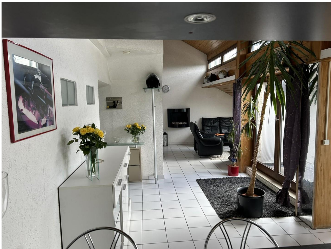
Einblick von Bar zu Wohnzimmer