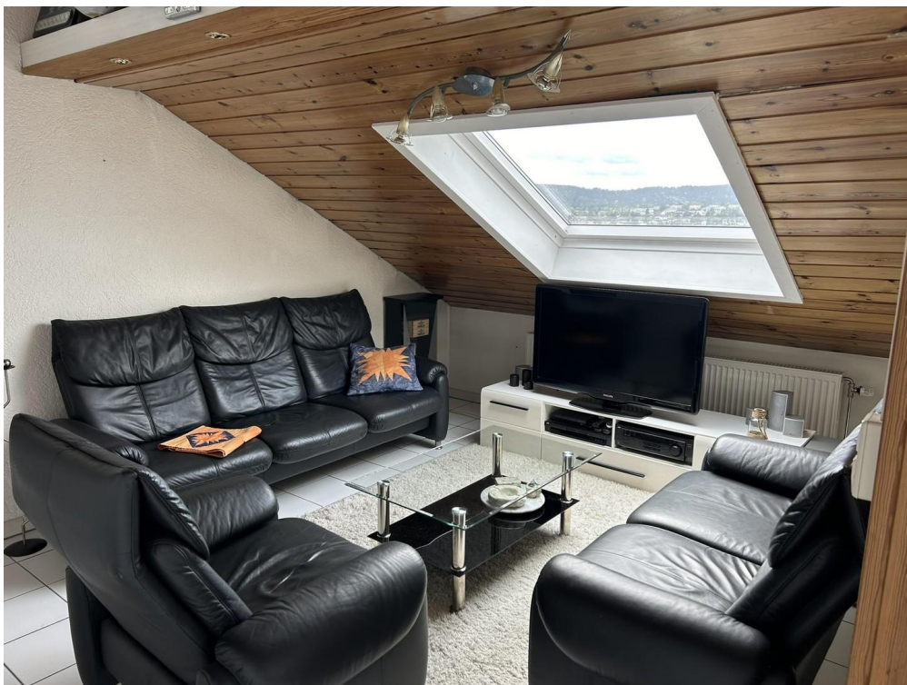
Wohnzimmer mit Dachfenster