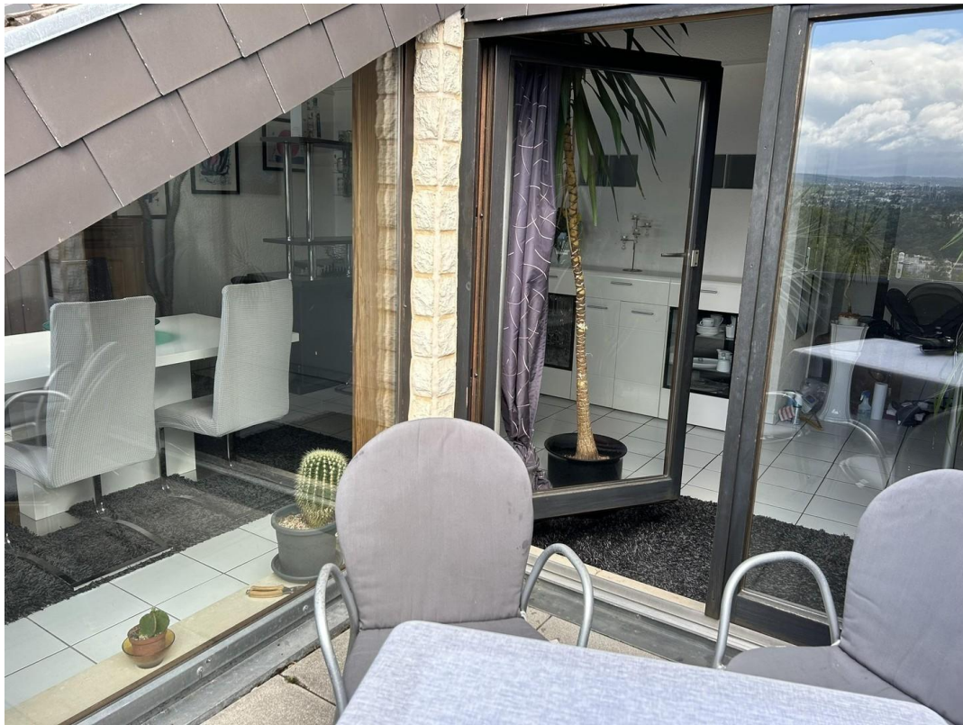
Glaselemente zu Wohn-Esszimmer