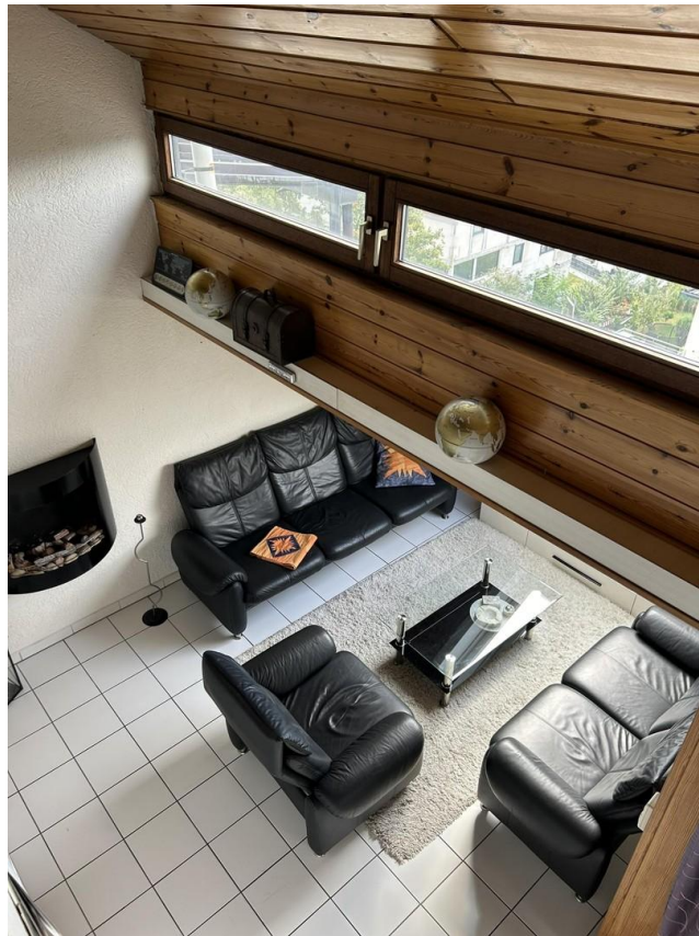
Sicht von Galerie - Wohnzimmer