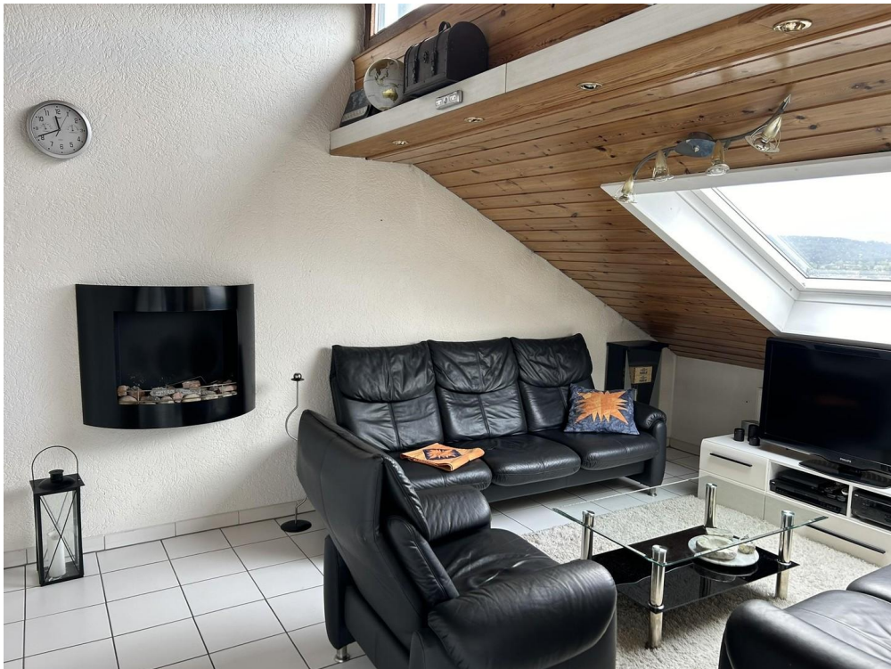
Wohnzimmer mit Wandkamin