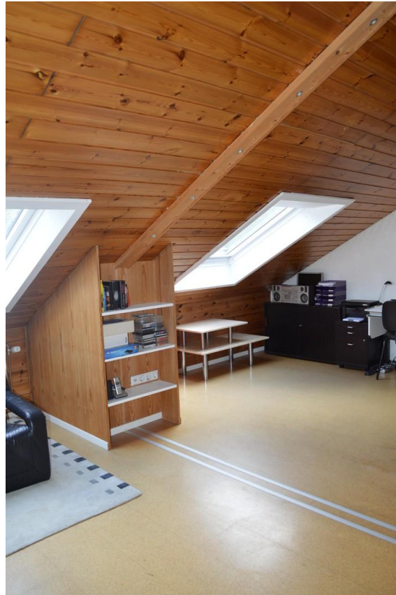
Flur und Büro 2. Stockwerk