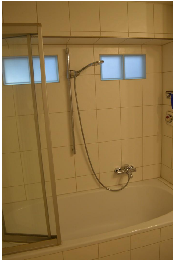
Badewanne mit Duscharmatur