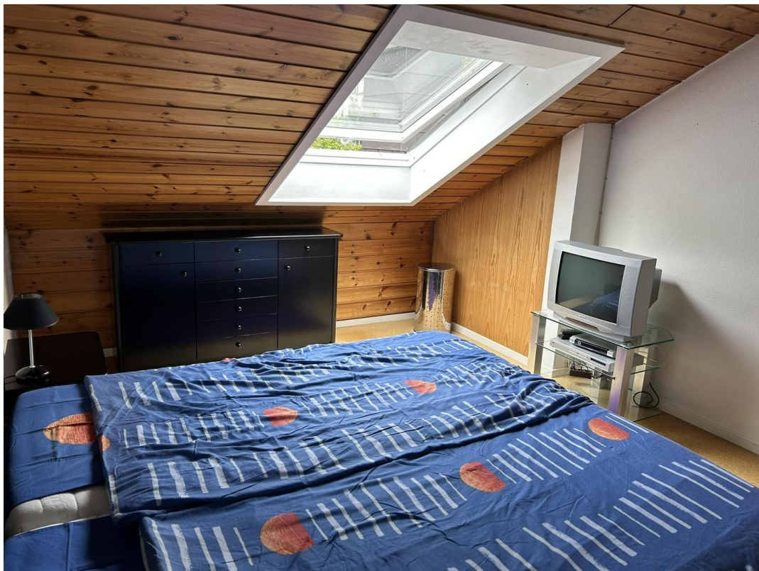
Schlafzimmer mit Dachfenster