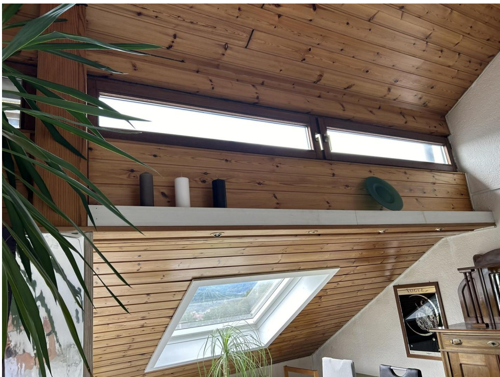
Oberlichter für Helligkeit