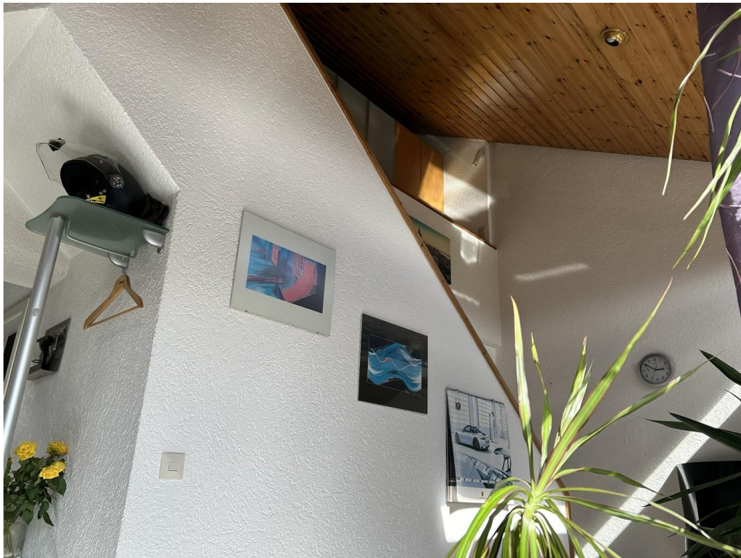
Ausblick zu Treppenaufgang