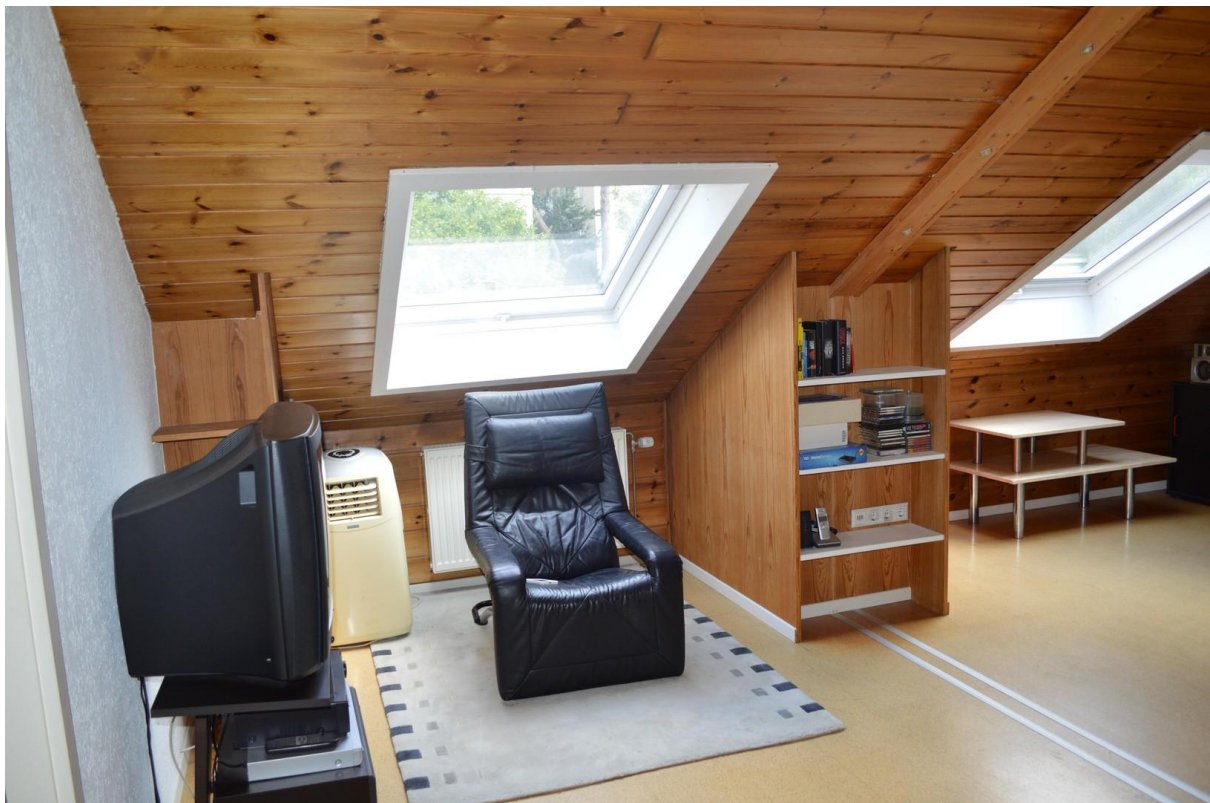
Flur und Büro 2. Stockwerk