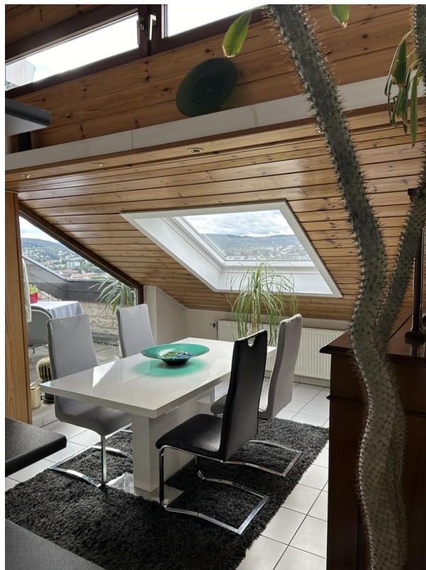
Essbereich mit Dachfenster