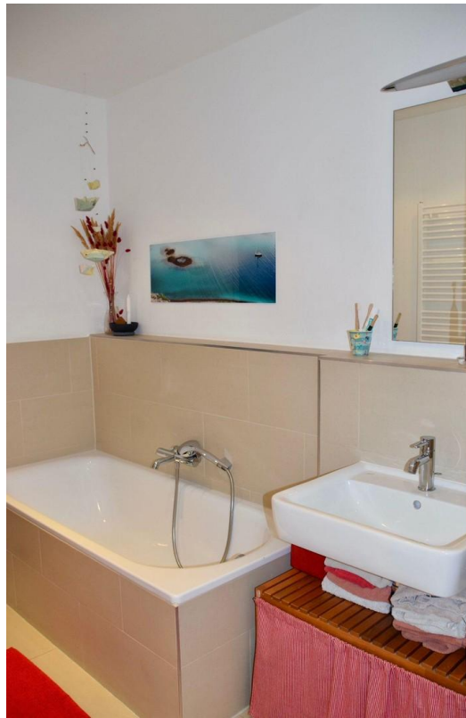
Badezimmer mit Wanne und Dusch