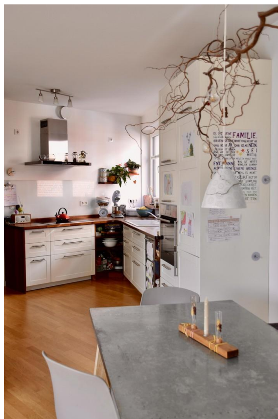
Essbereich & Küche