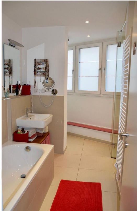
Badezimmer mit Wanne und Dusch