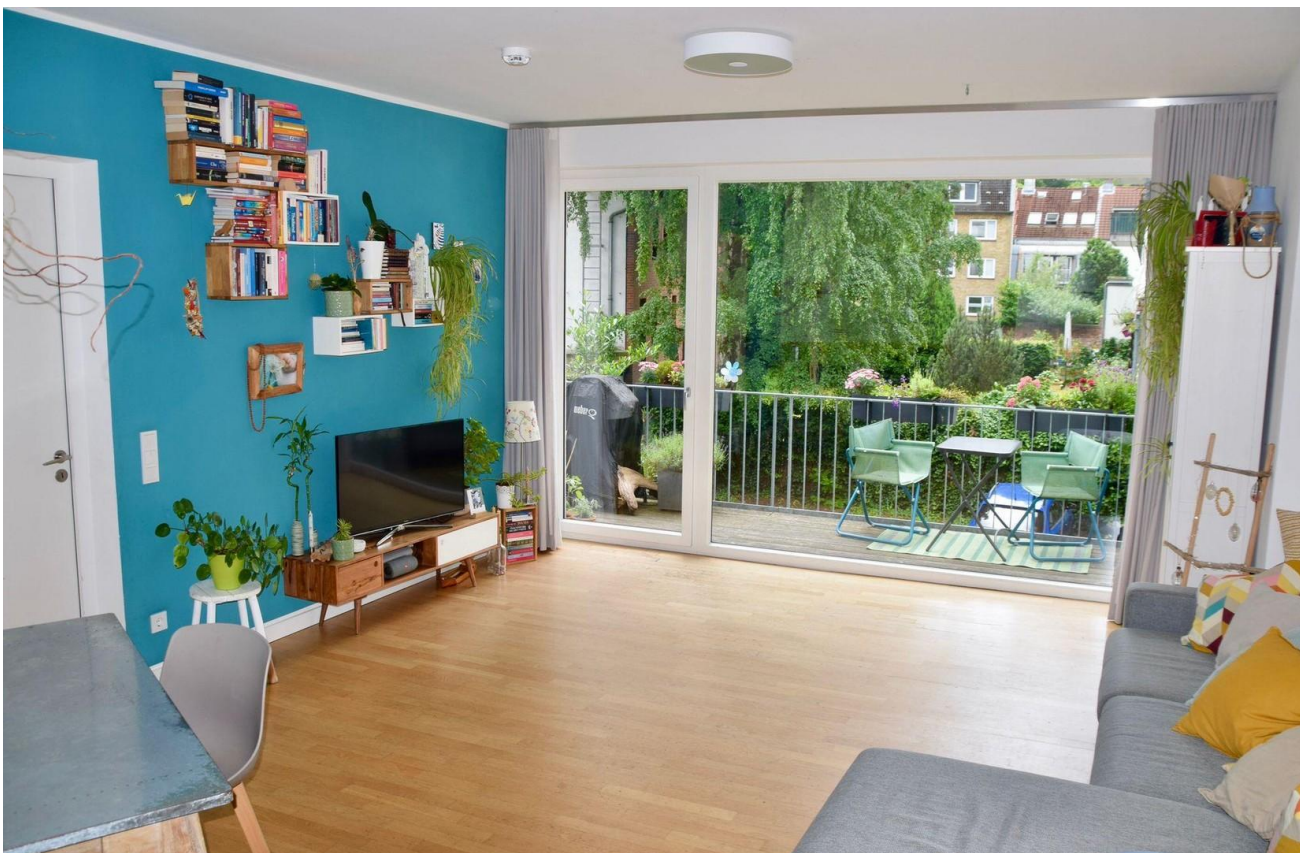
Wohnzimmer & Balkon