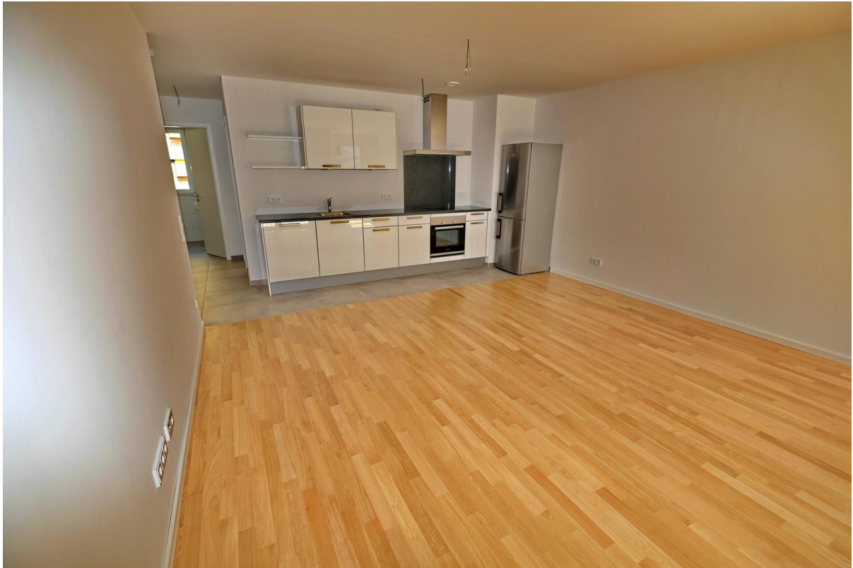
Wohnzimmer mit Küche