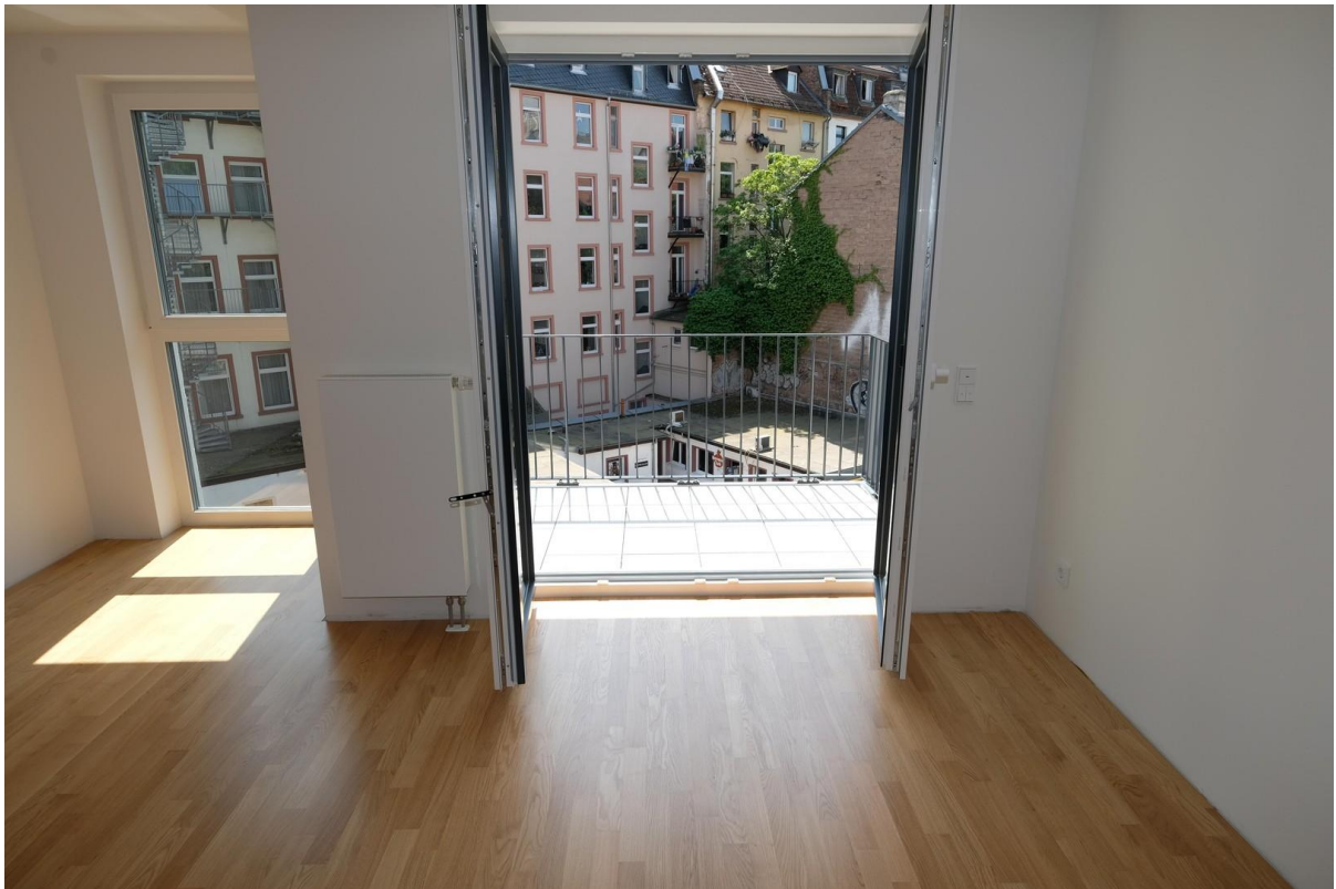
Wohnzimmer mit Balkon