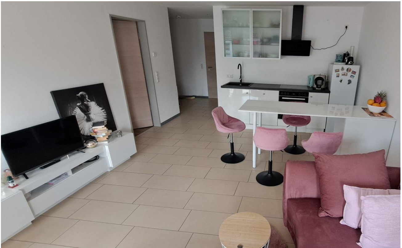
Koch- und Essbereich