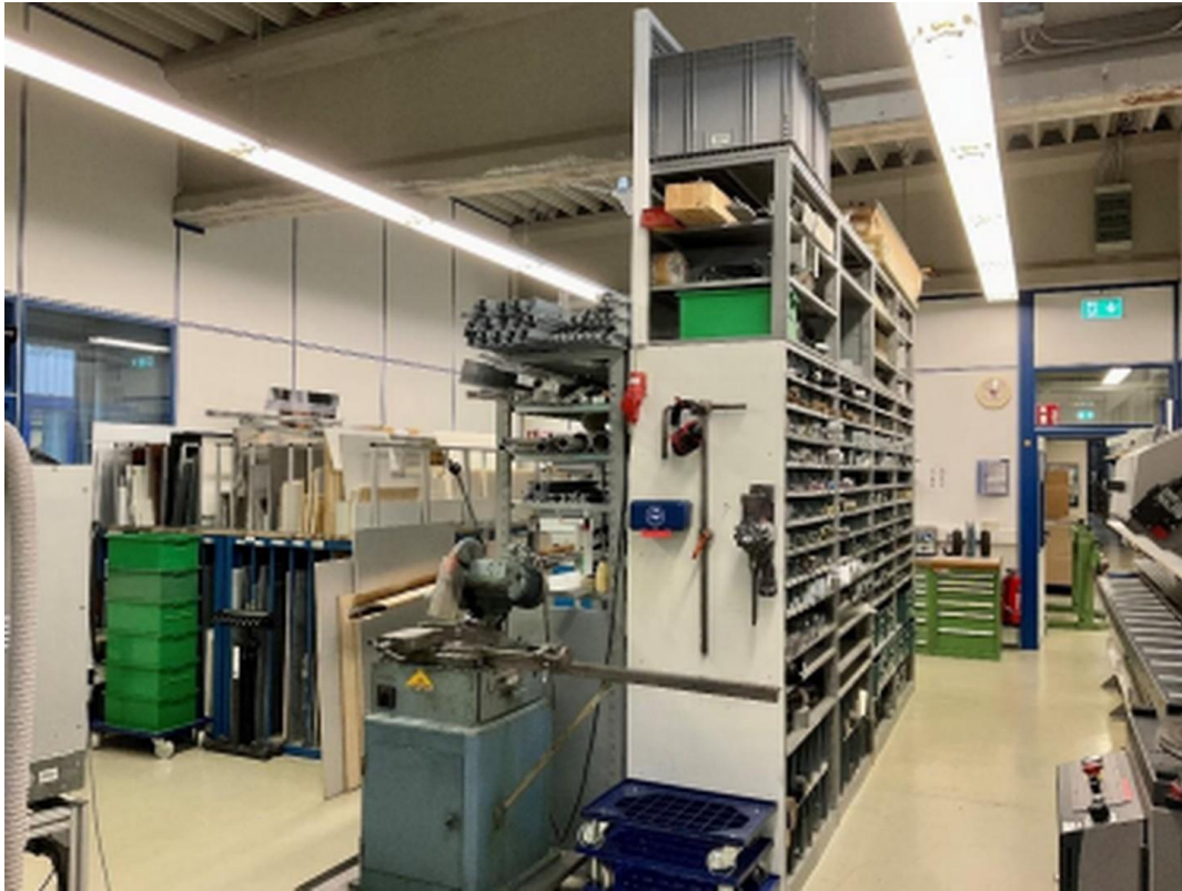
Halle 3 (Westseite)