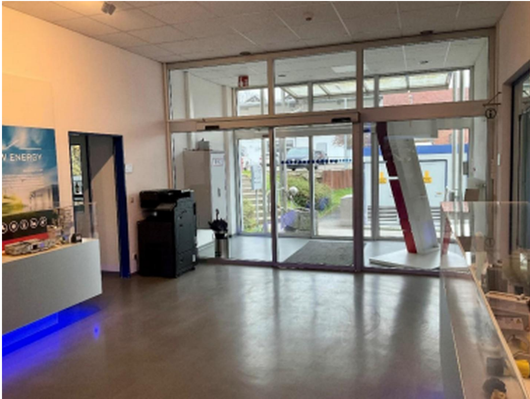
Eingang Halle 1