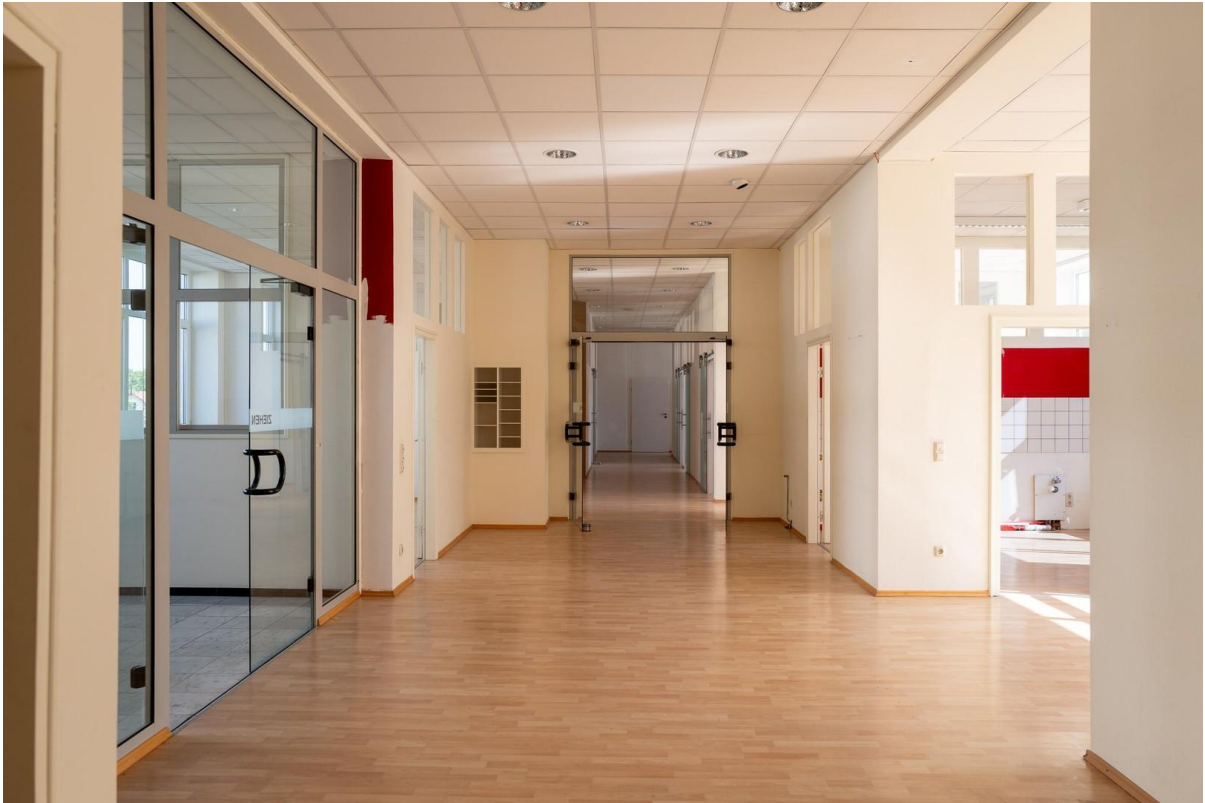
Empfangsber. m. Küche