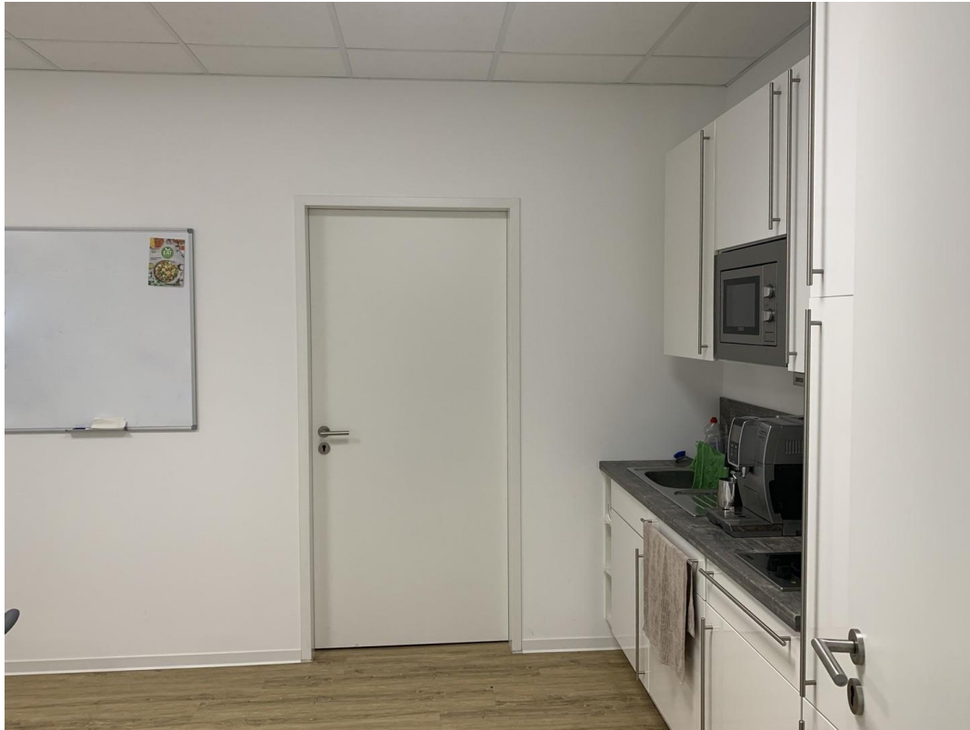
KÜCHE / TÜR SERVERAUM