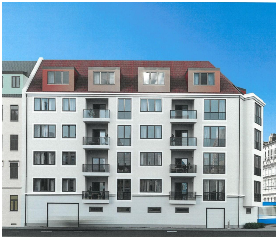
Gebäudeansicht gem. Bauantrag