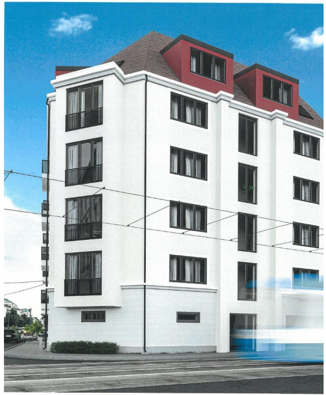
Gebäudeansicht gem. Bauantrag