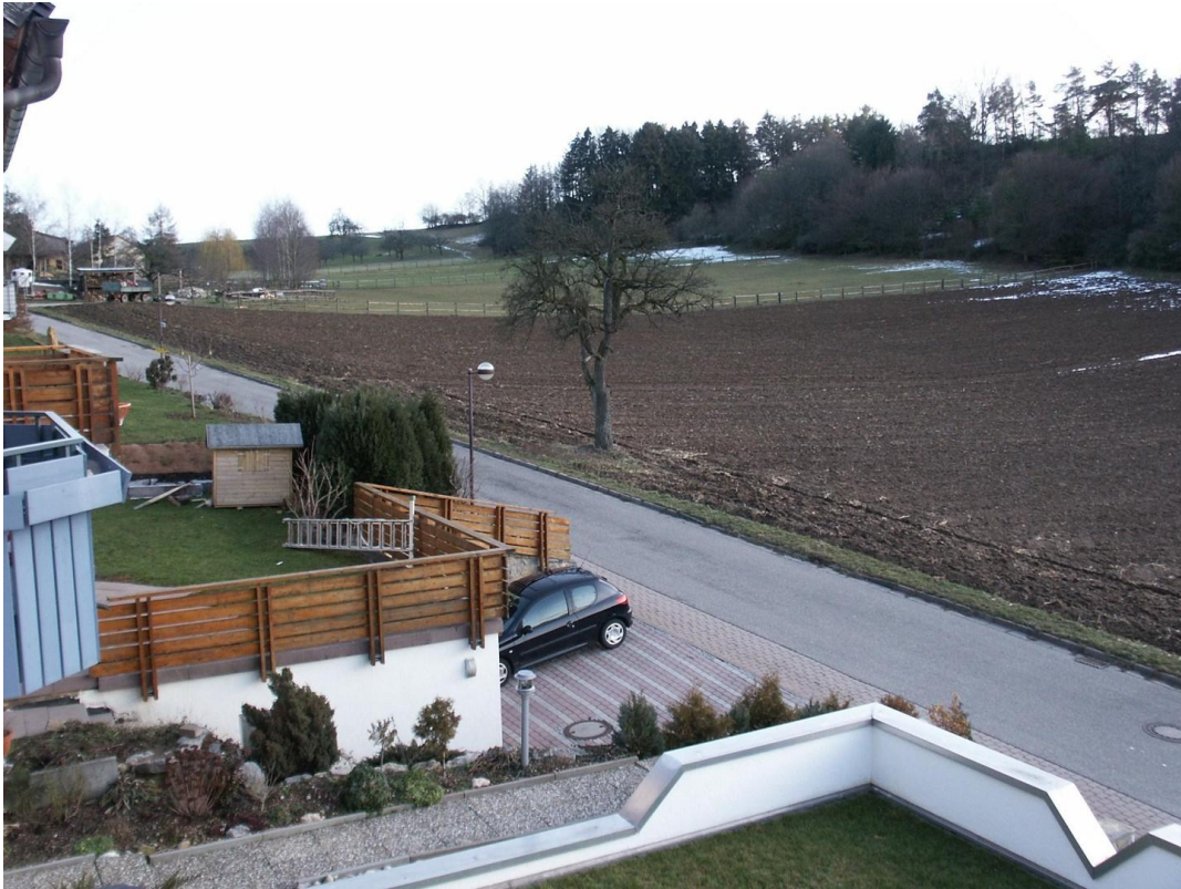
Blick vom Balkon/Terrasse