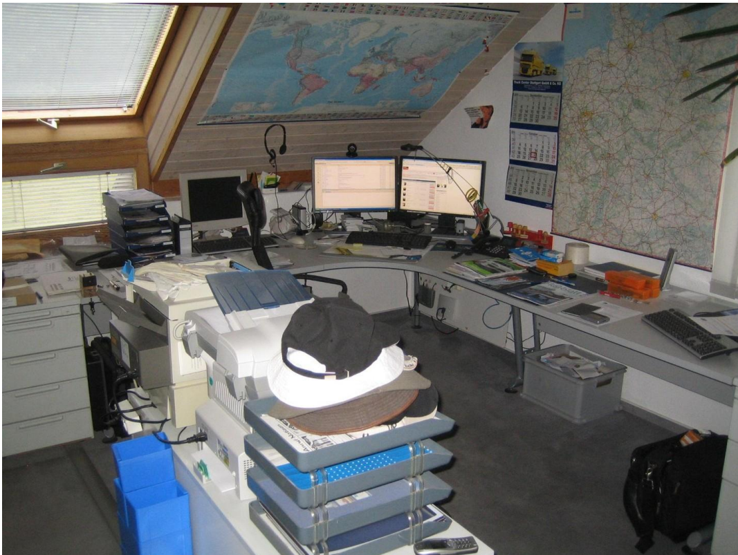
Teil des Büros