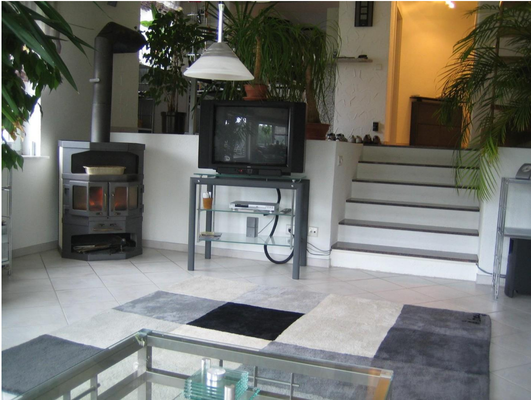
Wohn und Essbereich