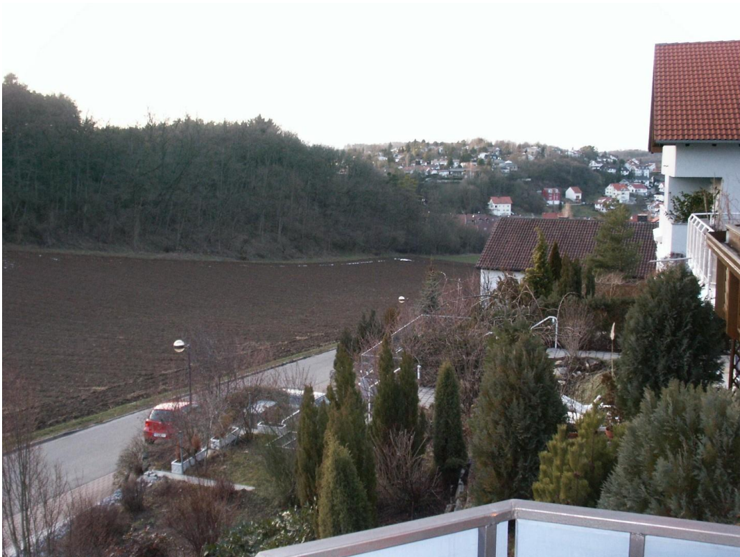
Blick vom Balkon/Terrasse