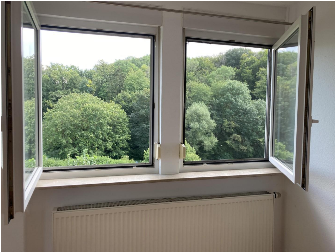
Ausblick aus dem Wohnzimmer