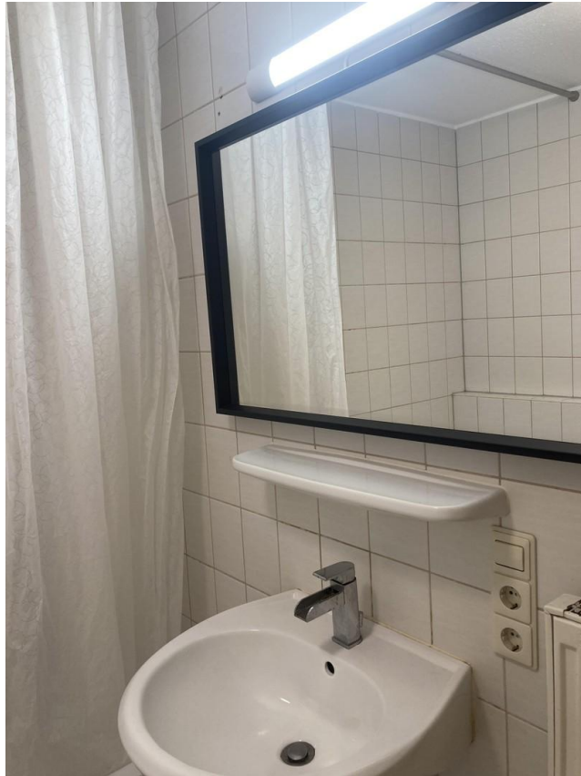
Helles Bad mit Wasserfall-Hahn