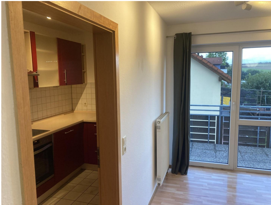
Wohn-/Esszimmer und Küche