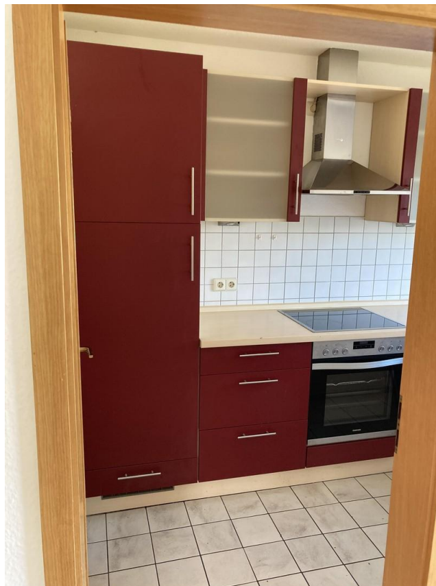
Einbauküche mit Spülmaschine