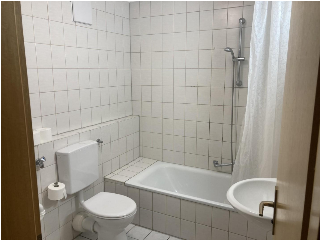
Bad mit Duschbadewanne