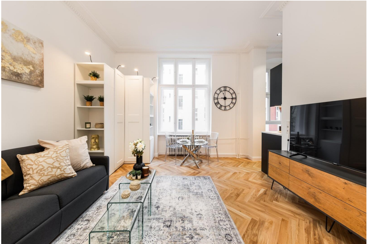
Titelbild - Wohnzimmer