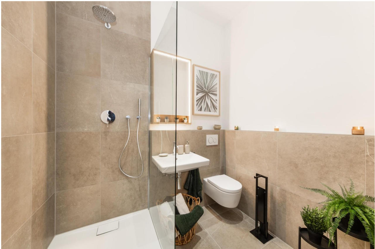
Titelbild - Badezimmer