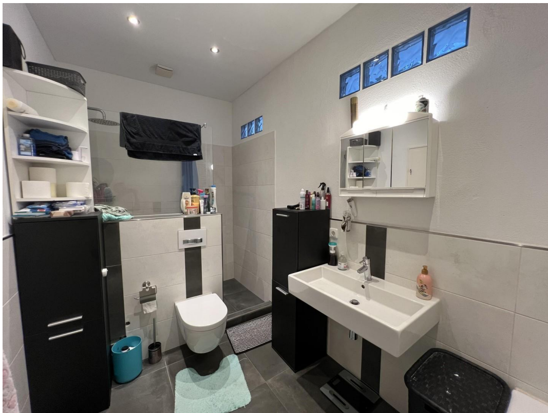
Bad mit bodengleicher Dusche