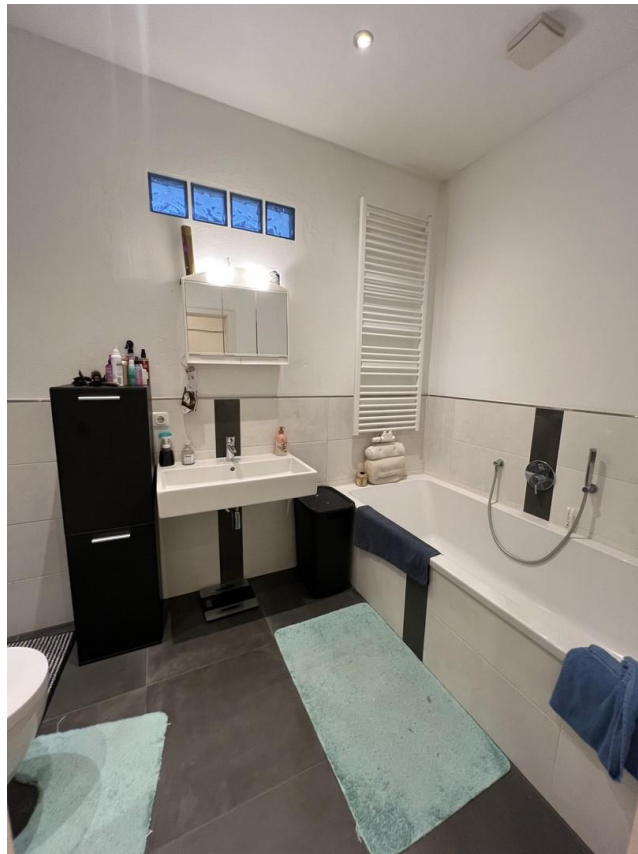
Bad mit Badenwanne