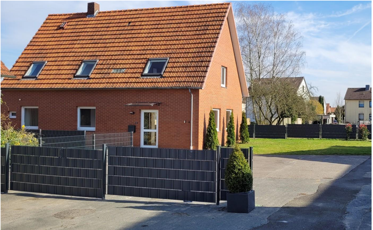
Hausansicht von Zufahrt