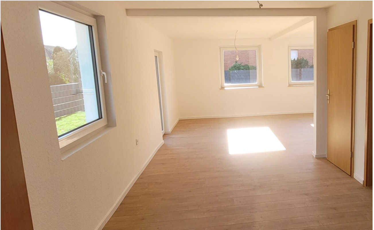
Wohn- und Esszimmer Ansicht 1