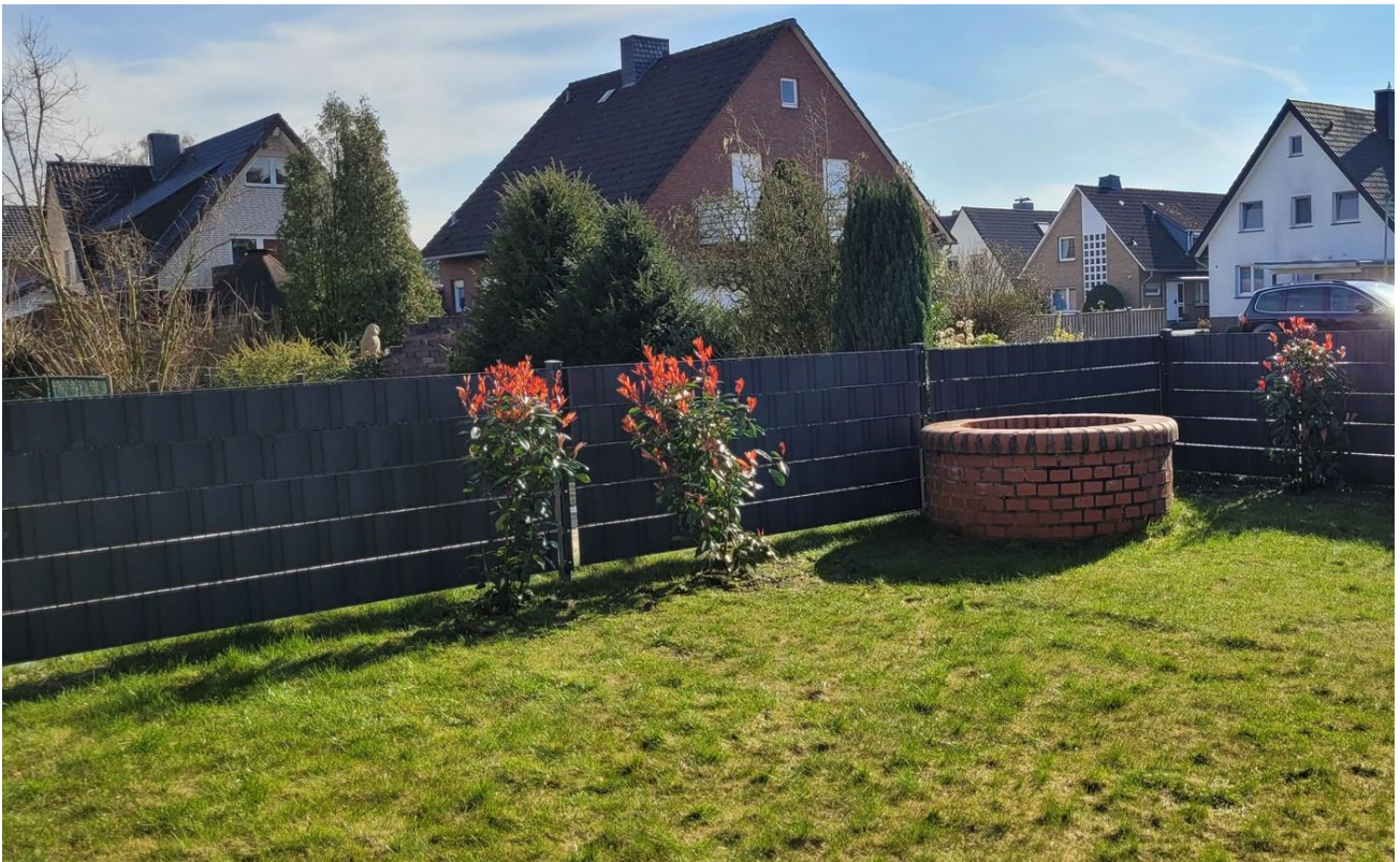
Brunnen im Garten