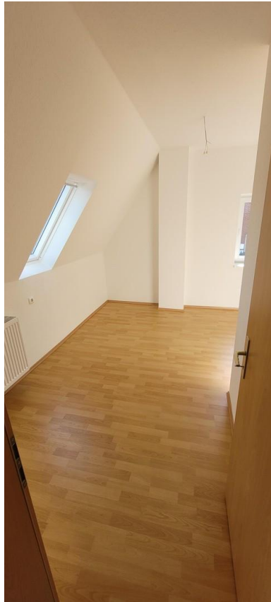
Schlafzimmer Kind 2 Ansicht 1