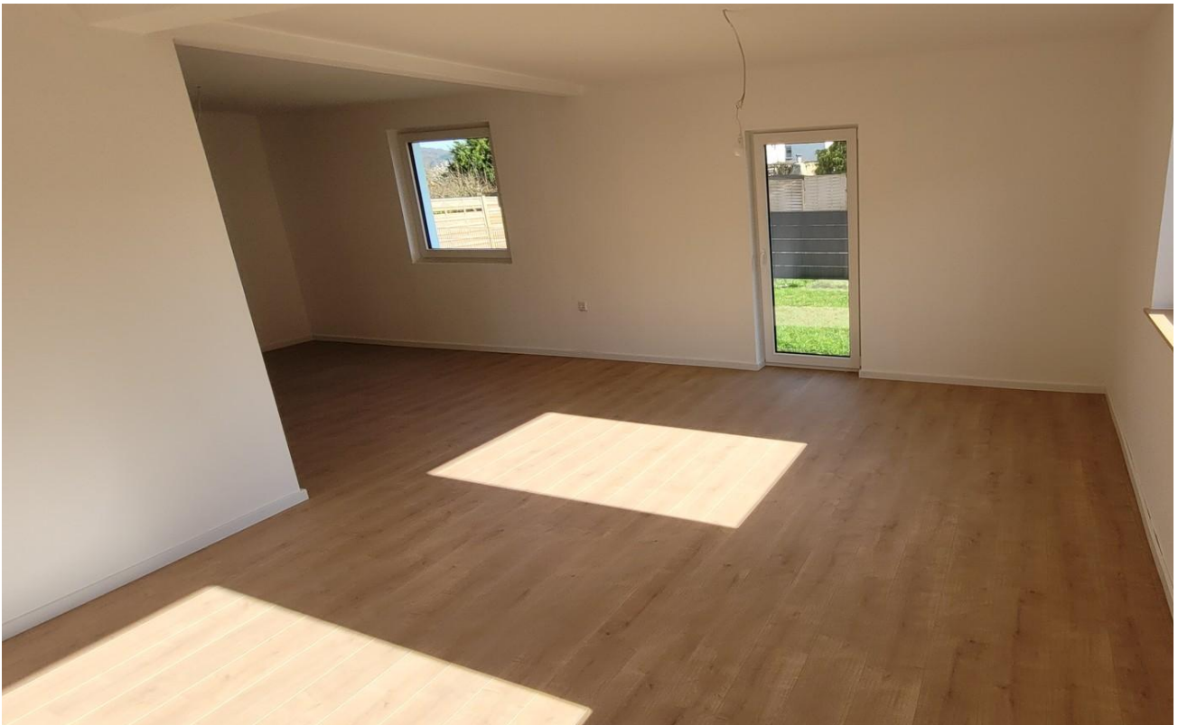
Wohn- und Esszimmer Ansicht 2