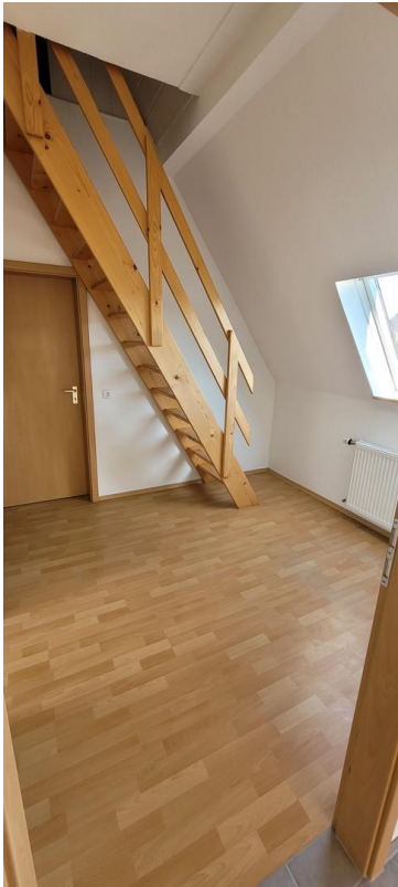
Flur mit Treppe zum Spitzboden