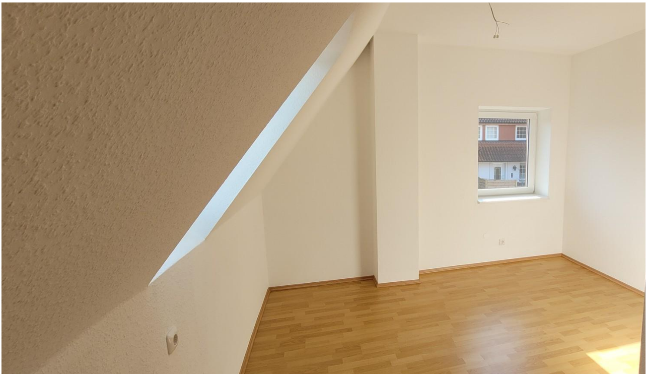
Schlafzimmer Kind 2 Ansicht 2