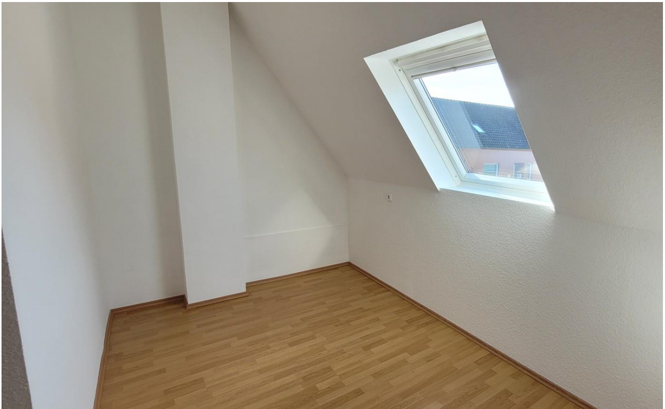
Schlafzimmer Kind 1 Ansicht 2