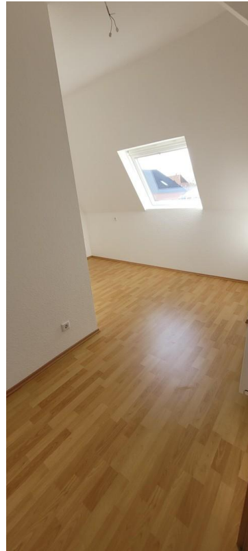
Schlafzimmer Kind 1 Ansicht 1