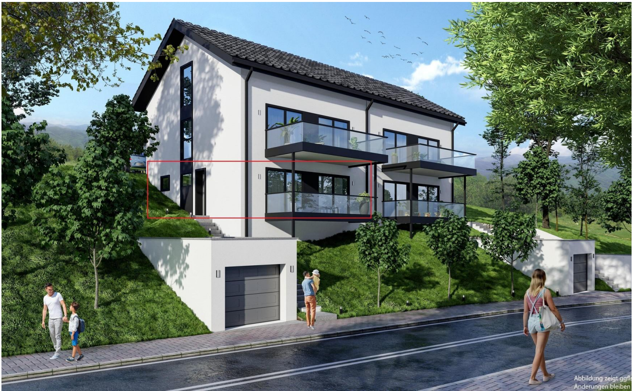
Haus Ansicht hinten re