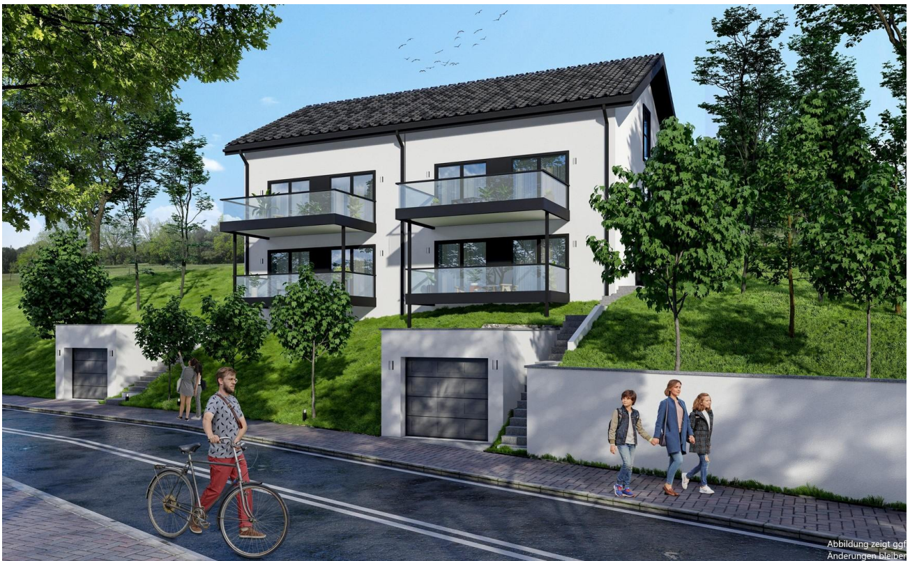
Haus Ansicht hinten li