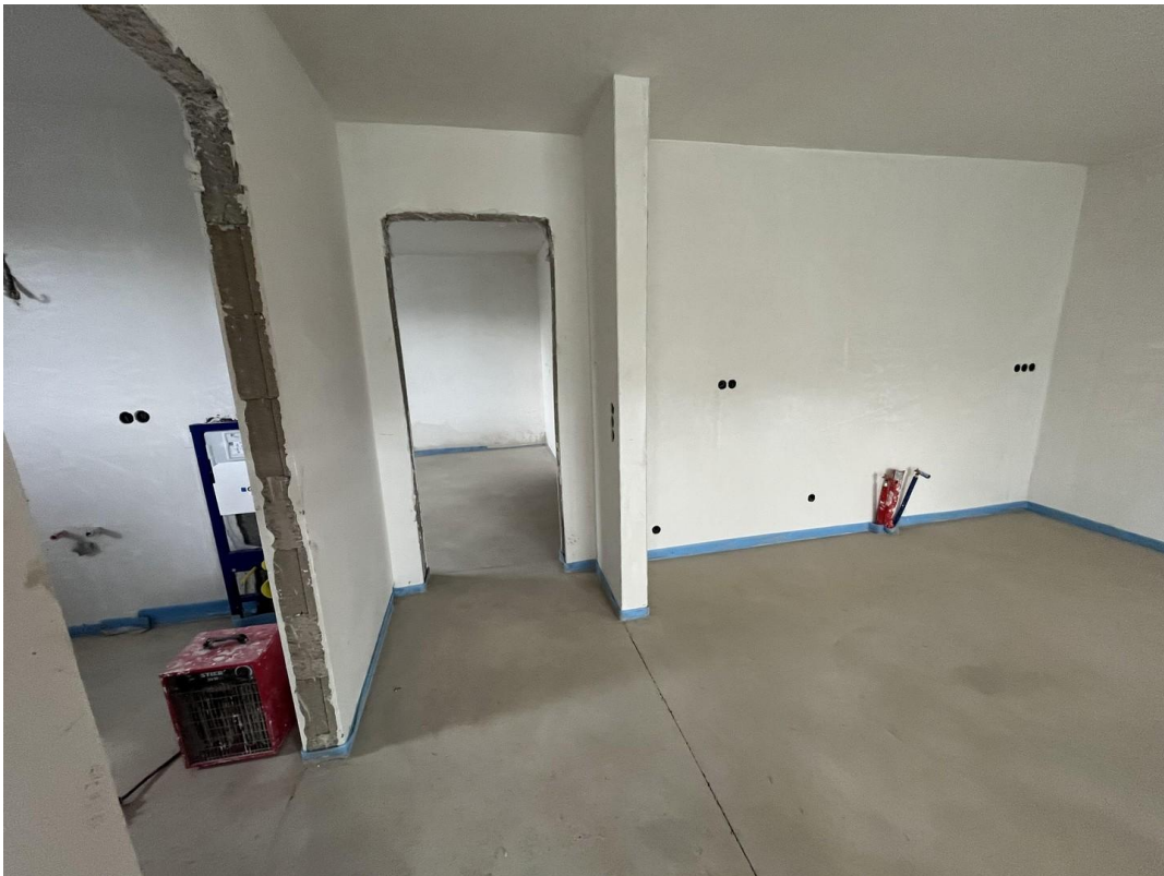
Wohnzimmer Bild 3