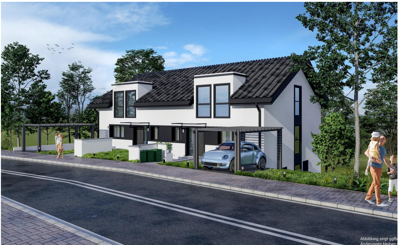
Haus Ansicht vorne li

Abbildung zeigt ggfls Änderungen bleiben