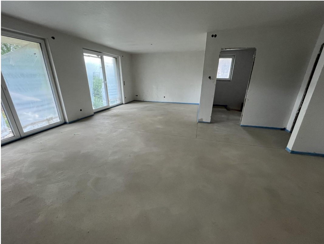
Wohnzimmer Bild 2