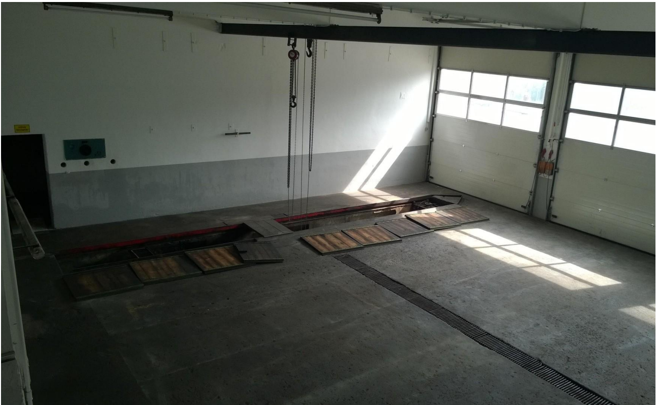
Blick auf das Erdgeschoss