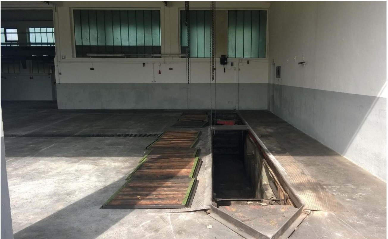
Begehbare Arbeitsgrube für LKW