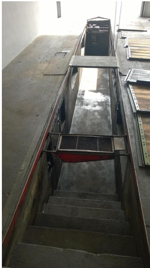
Arbeitsgrube mit Ölfang