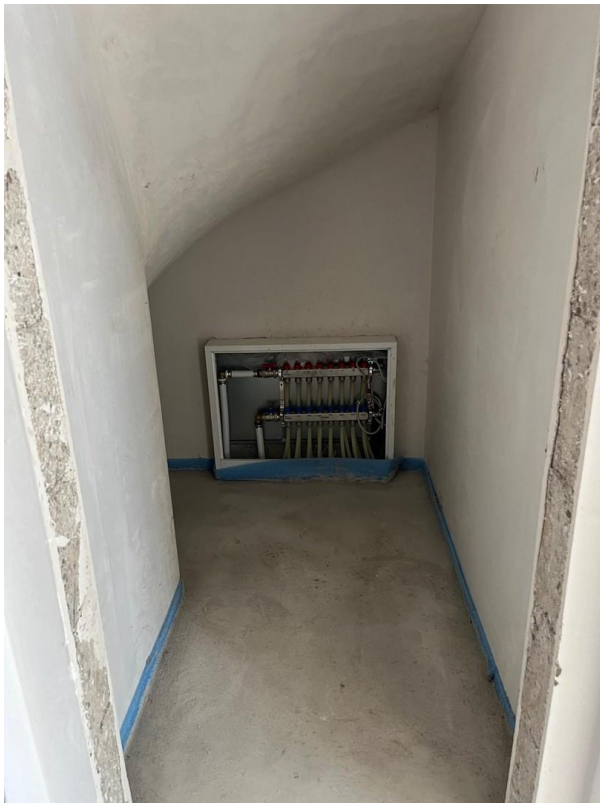
Abstellraum unter Treppe