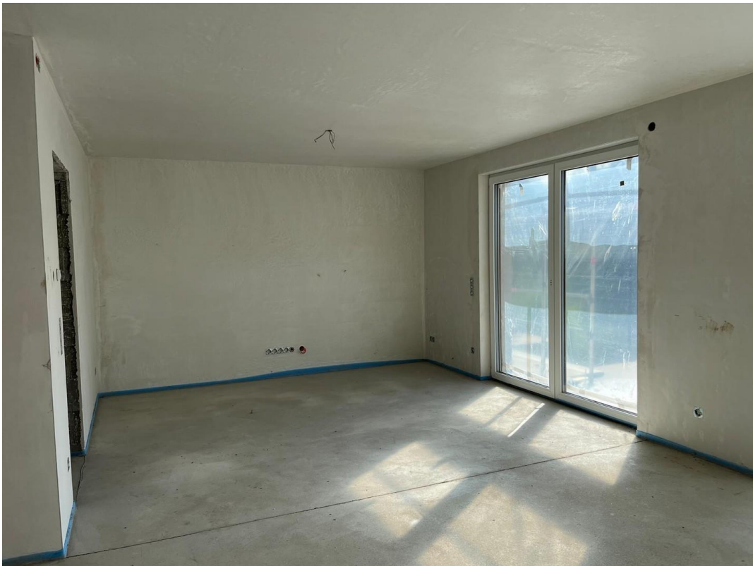
Wohnzimmer Bild 2