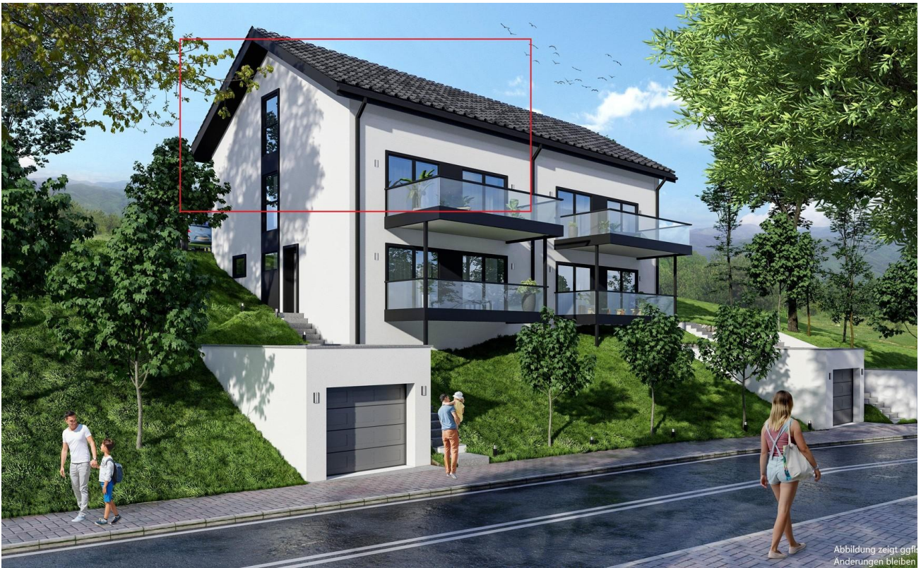
Haus Ansicht hinten re