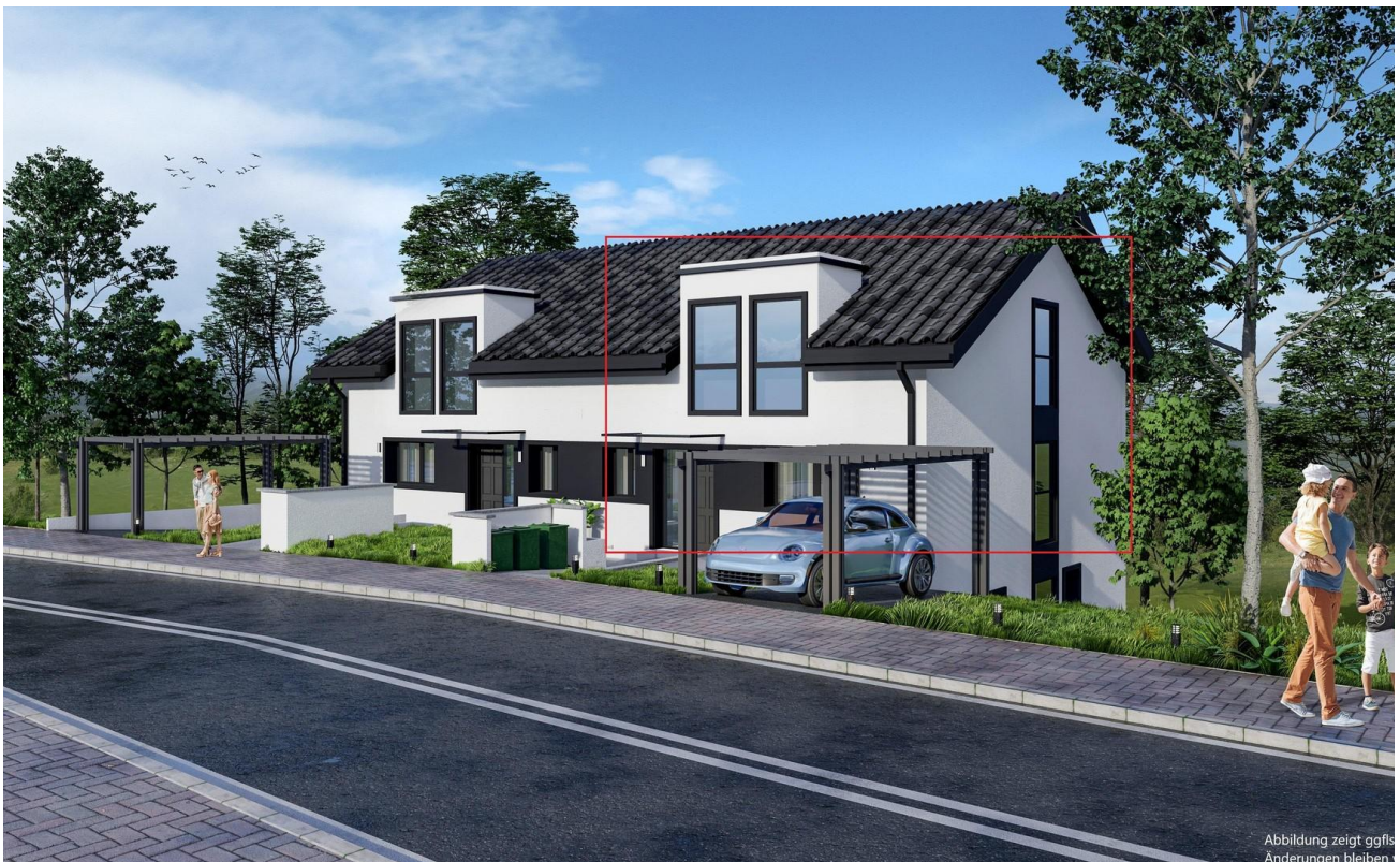
Haus Ansicht vorne li