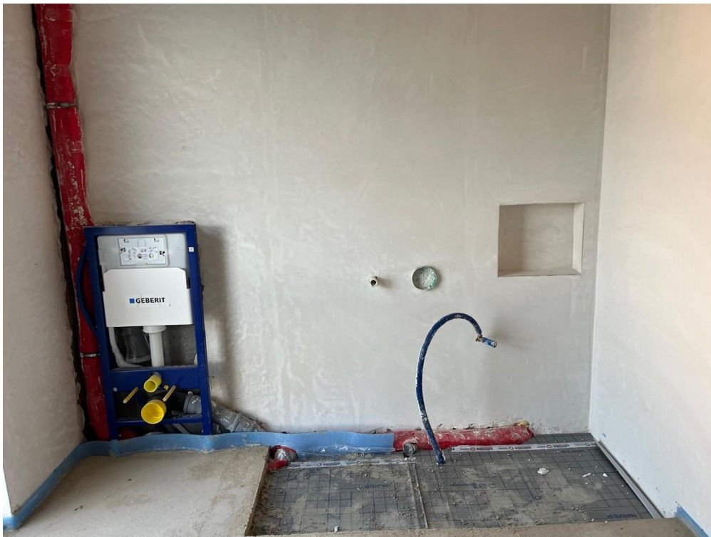
Badezimmer Bild 1