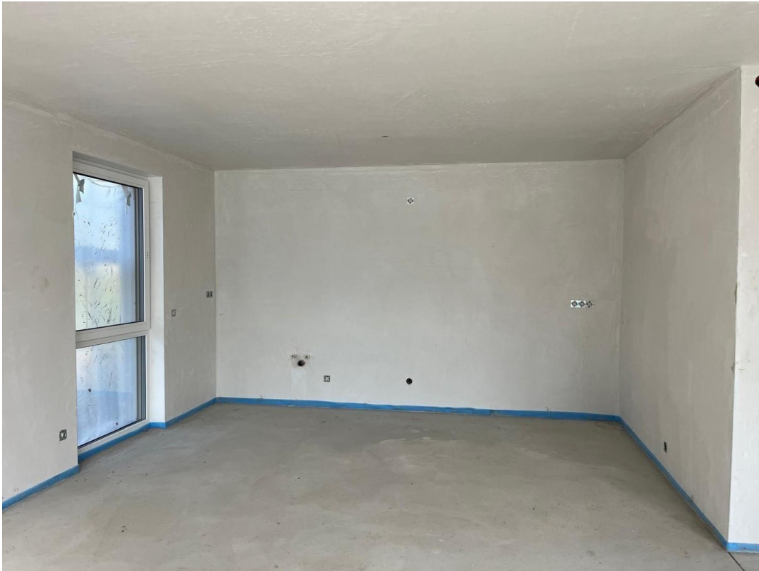
Wohnzimmer Bild 1