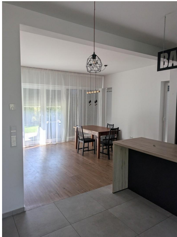
vom Flur blickend