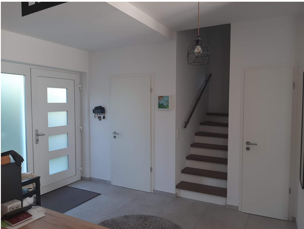
Flur u Hauseingangstür