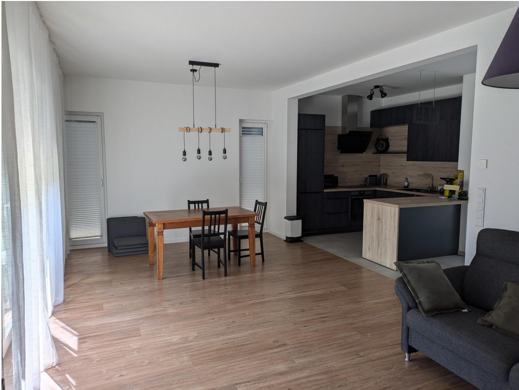
vom Wohnzimmer blickend