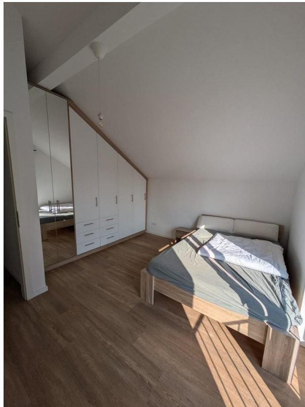
Schlafzimmer m Einbauschränk