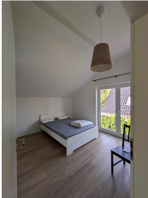
Arbeits- o Kinderzimmer