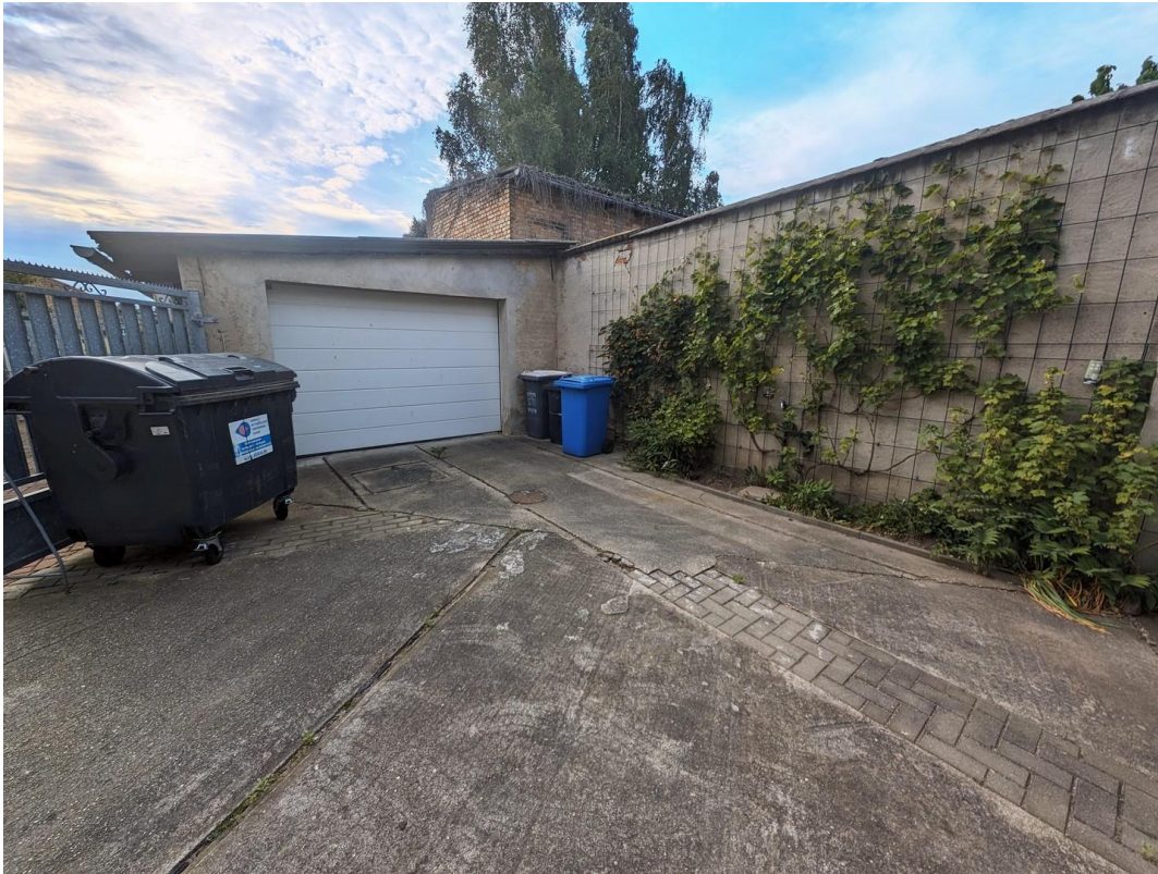
Garage № 2