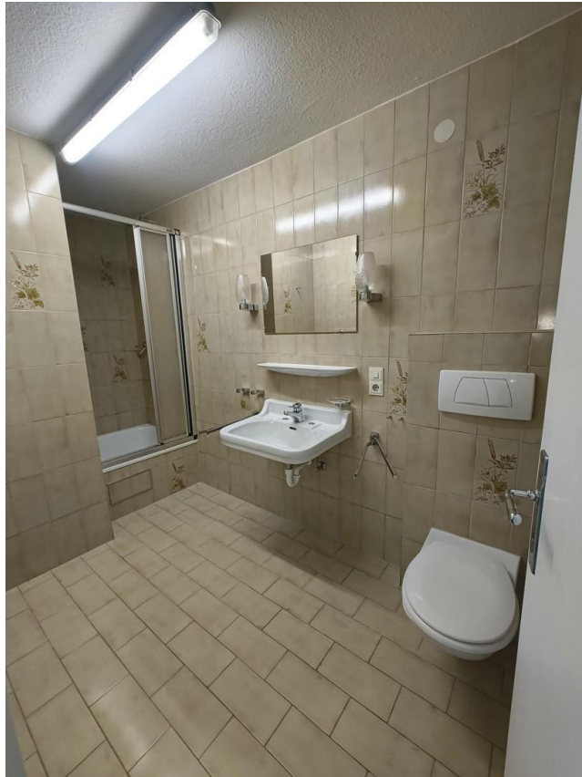
Bad angeschlossen an Raum 2 UG