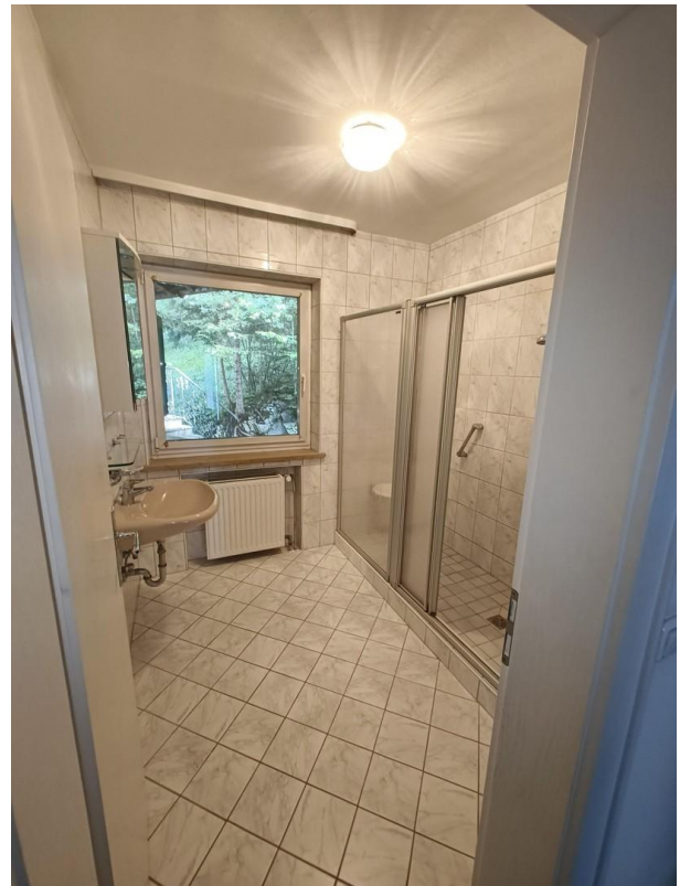
Bad im EG