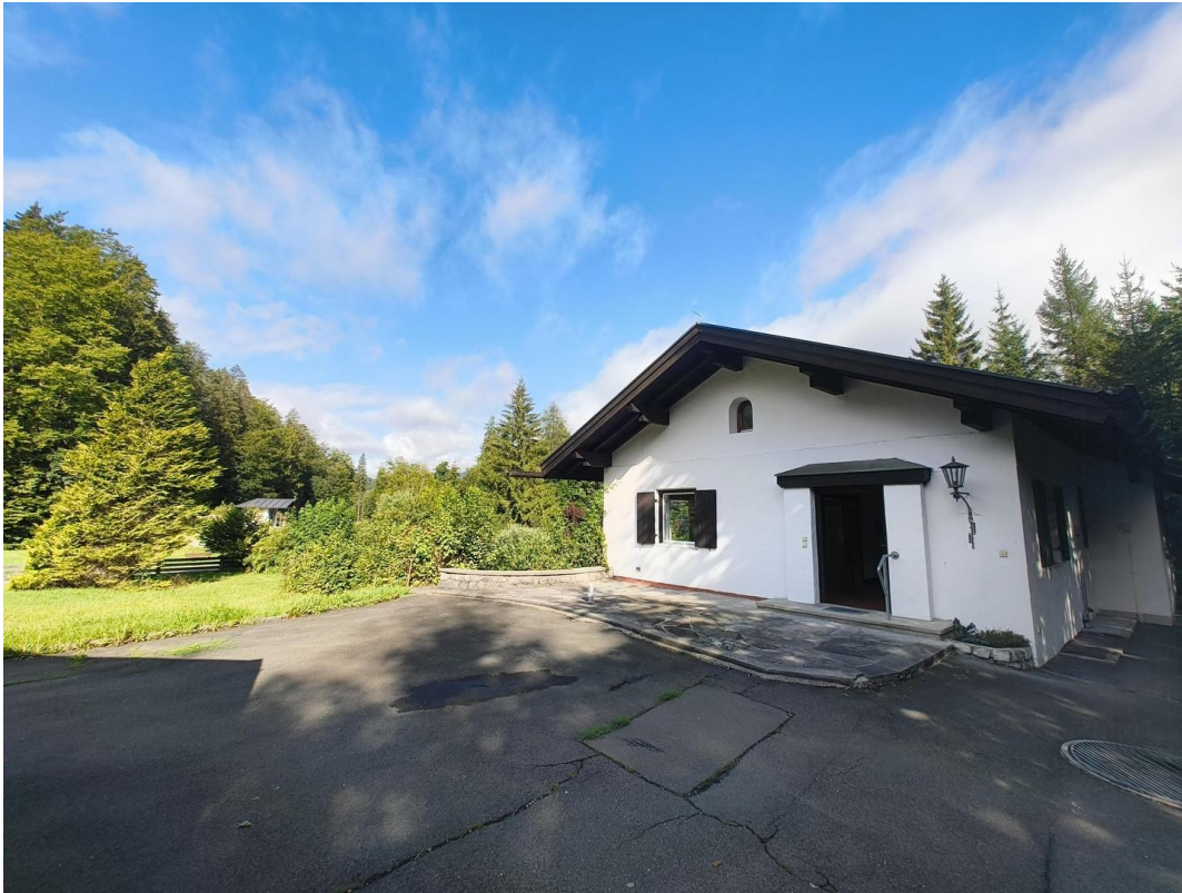
Außenansicht von oben