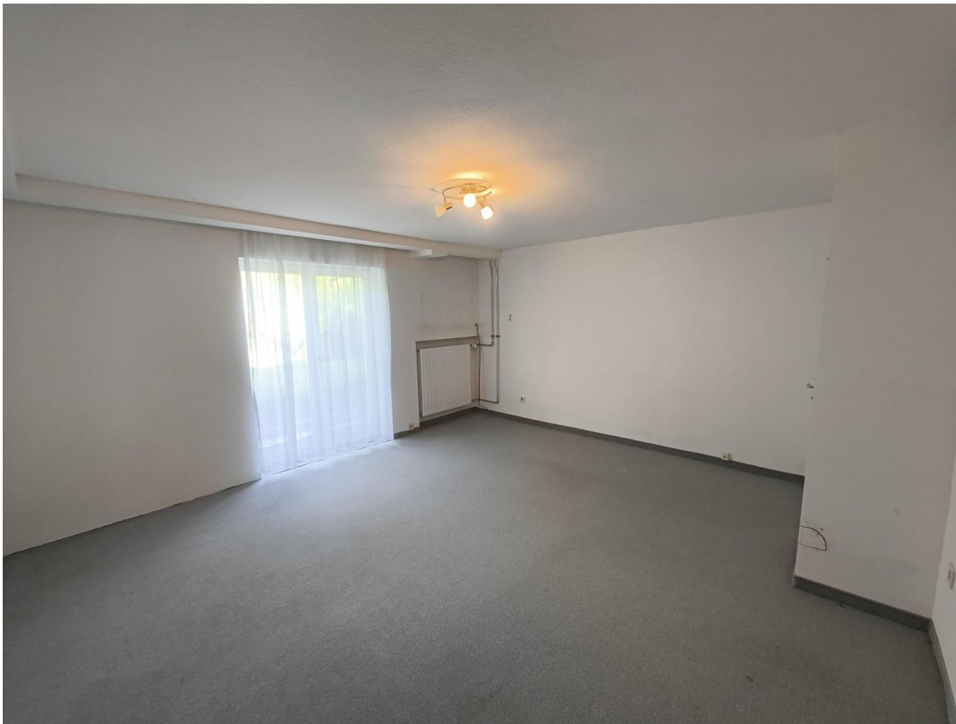
Raum 1 im UG