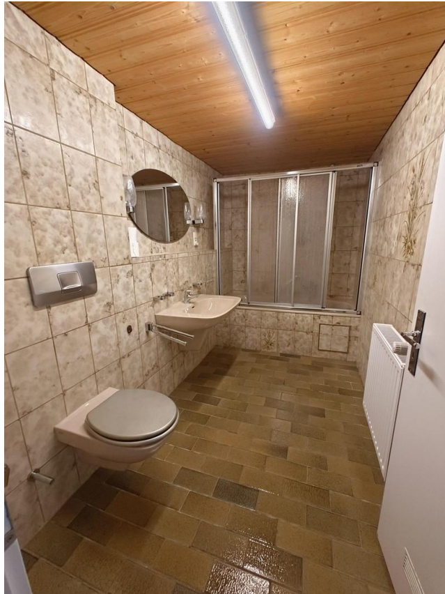
Bad angeschlossen an Raum 1 UG