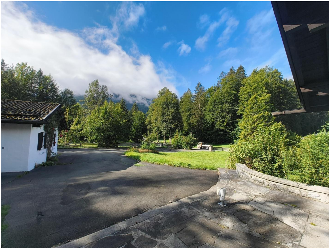
Blick aus der Haustür