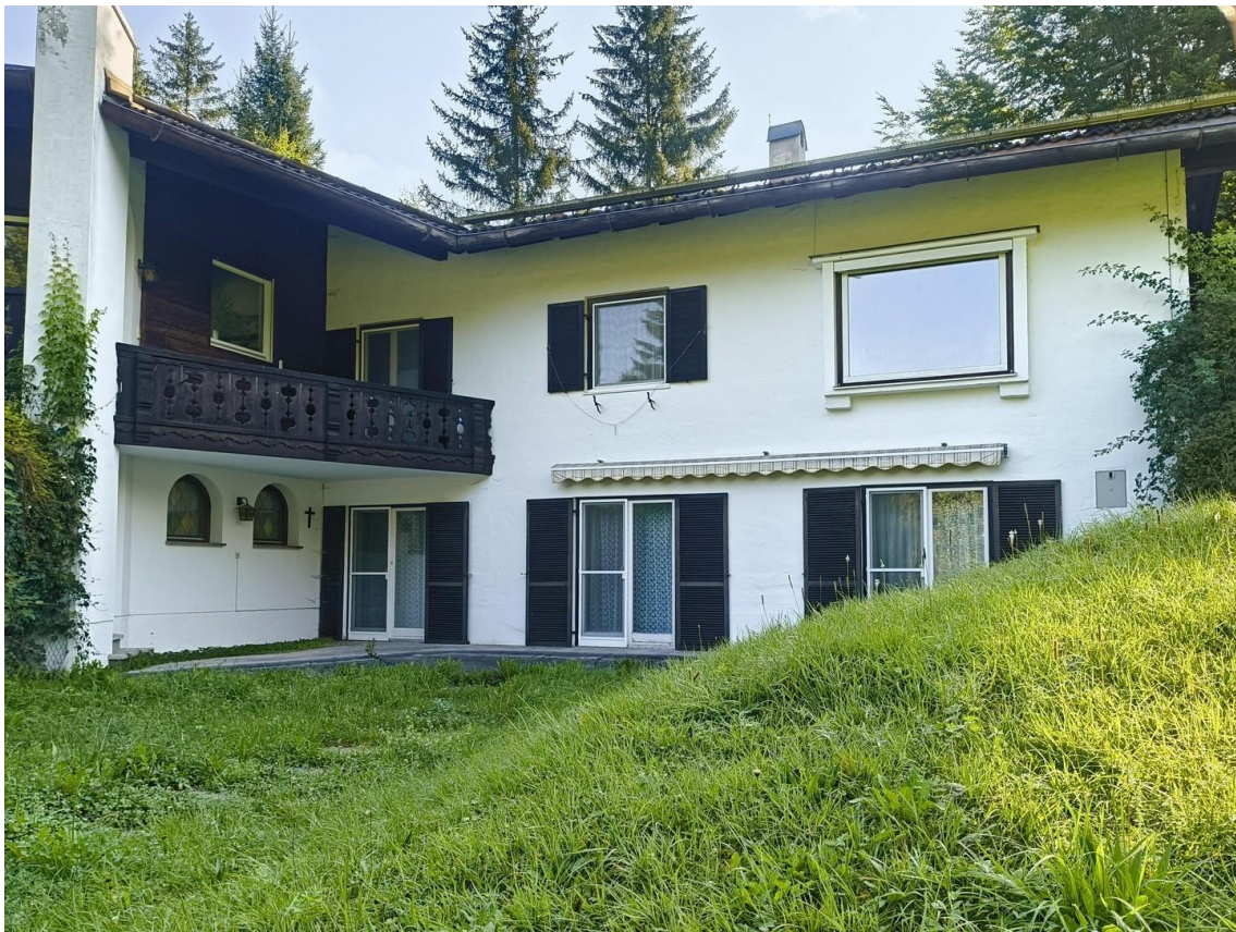
Blick vom Garten