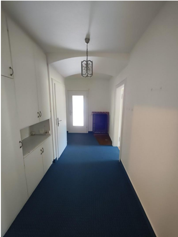
Flur EG mit Einbauschränk