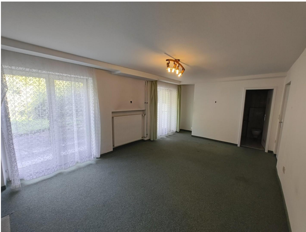
Raum 2 im UG