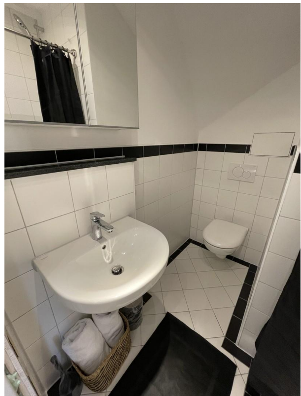
Bad von Musterwohnung