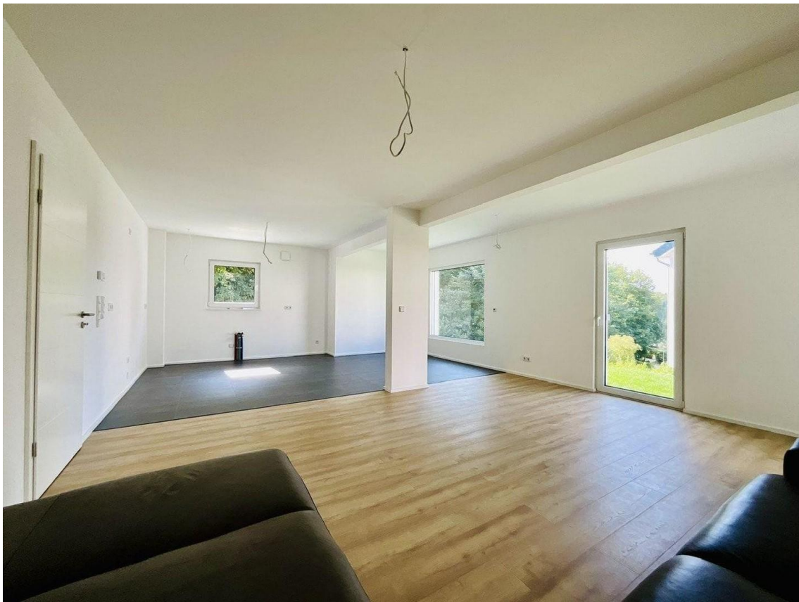
Wohnküche Sicht 1/2