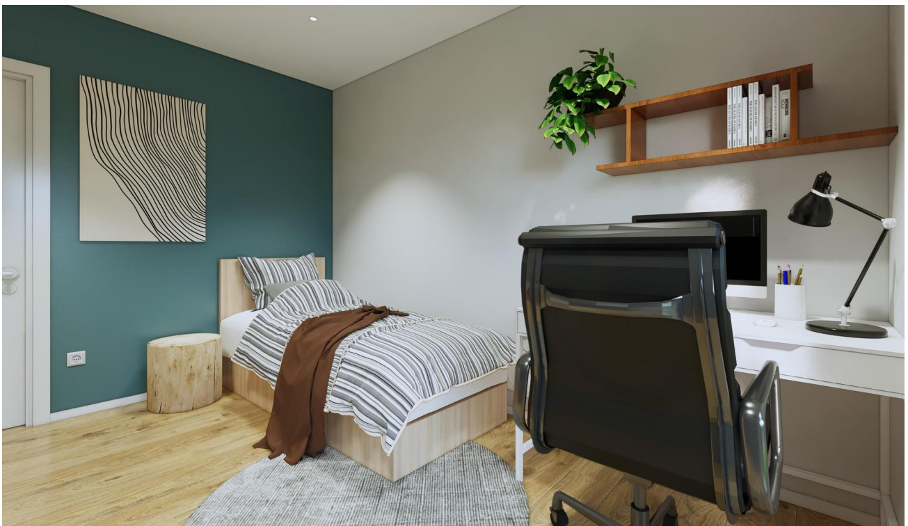
2. Kinderzimmer als Beispiel