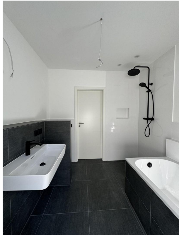
Bad Sicht 2/2