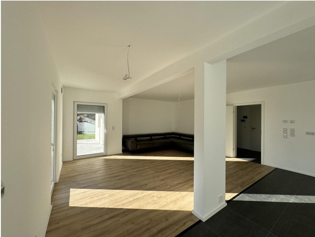
Wohnküche Sicht 2/2