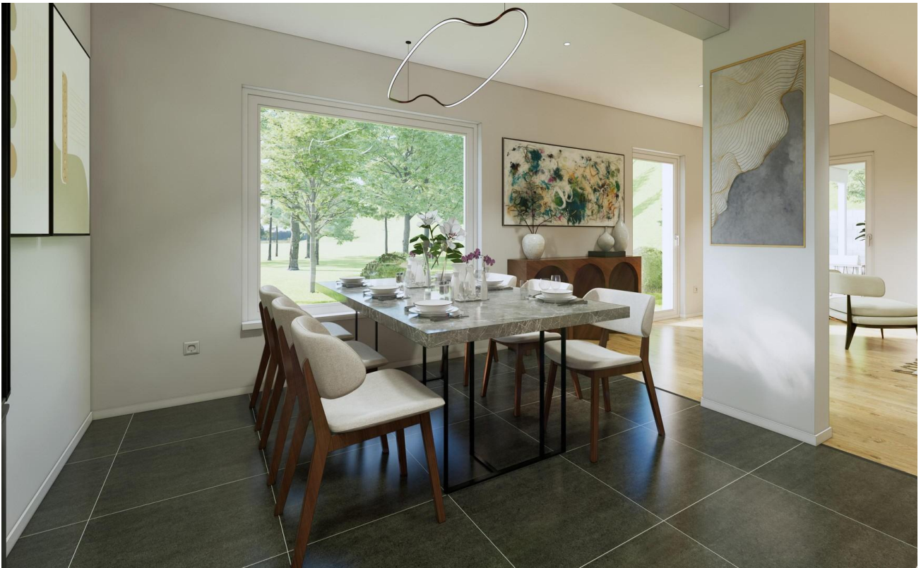
Wohnküche als Beispiel 2/2