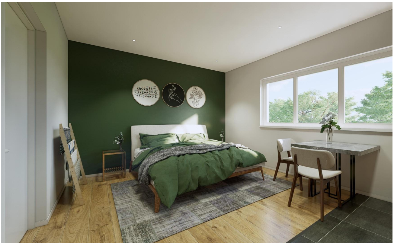
Gäste-Bereich als Beispiel