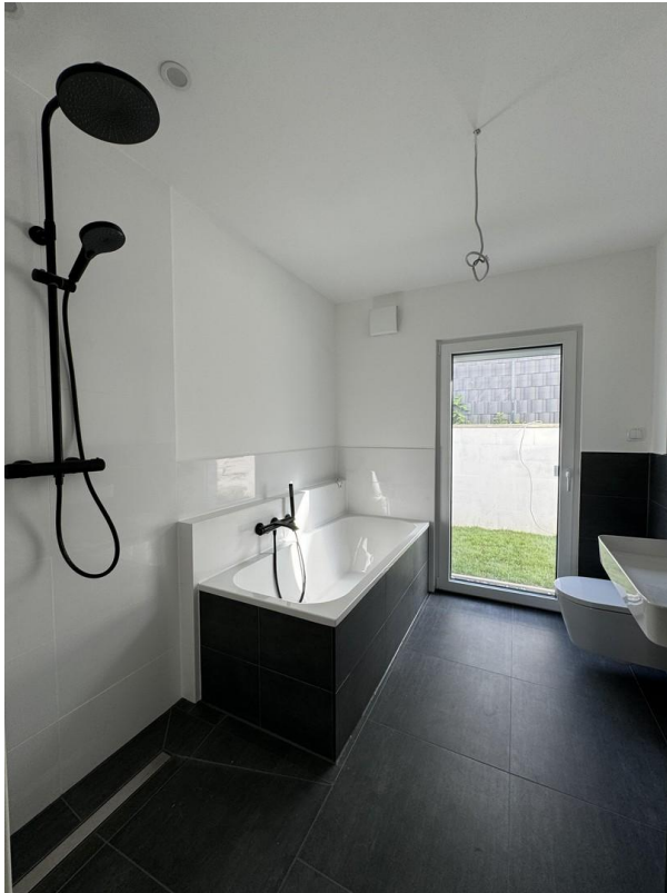
Bad Sicht 1/2