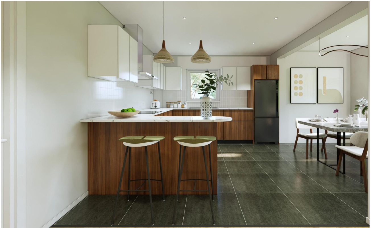
Wohnküche als Beispiel 1/2