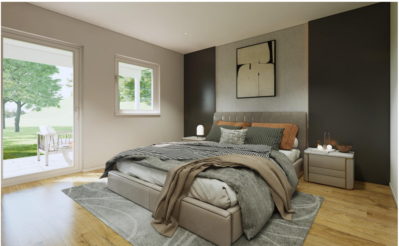
Schlafzimmer als Beispiel