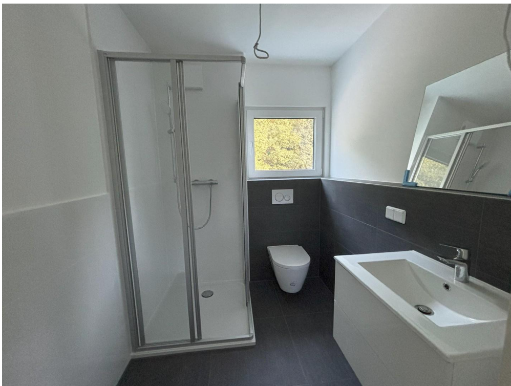
Gäste-WC im OG