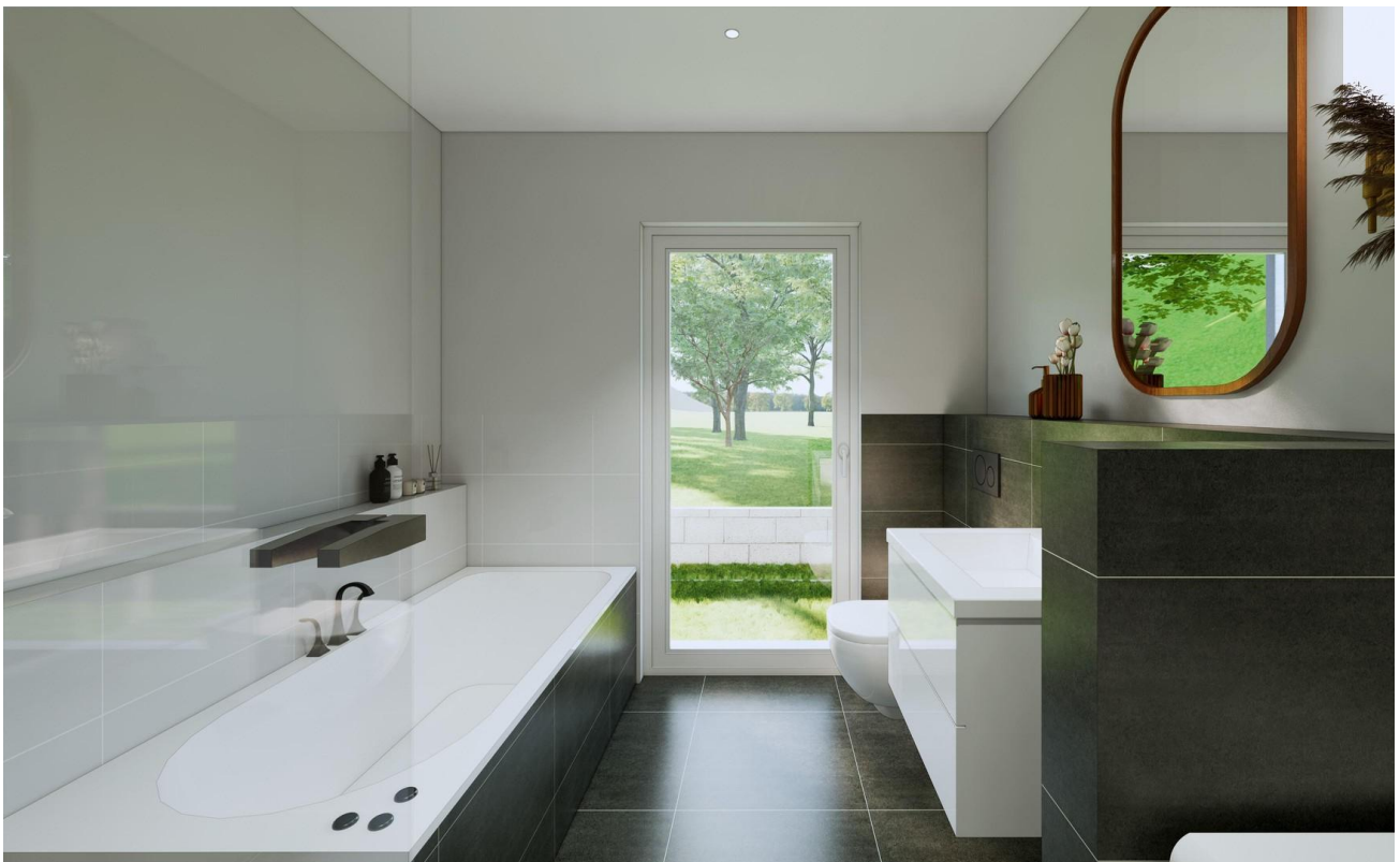
Bad als Beispiel