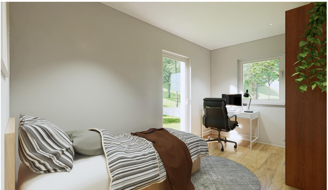
1. Kinderzimmer als Beispiel