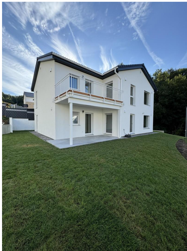
Garten zur alleinigen Nutzung