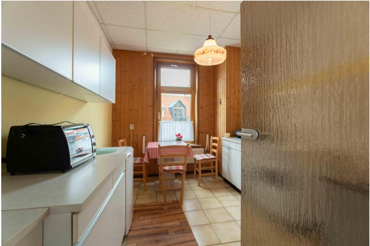
Küche vom Flur