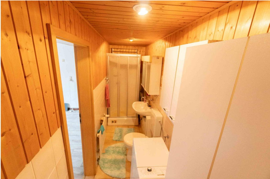
Duschbad mit WC