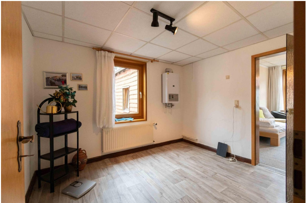
Zimmer zum Duschbad