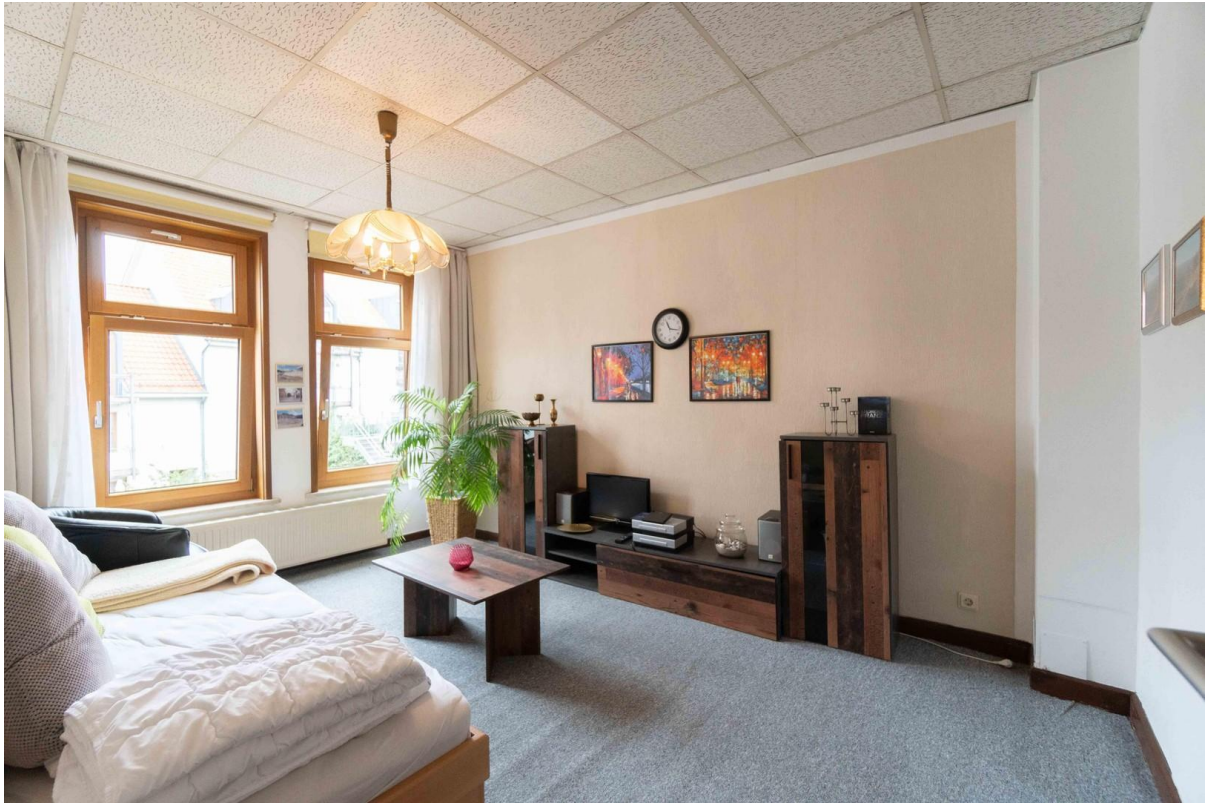
Wohnzimmer / Schlafzimmer 2