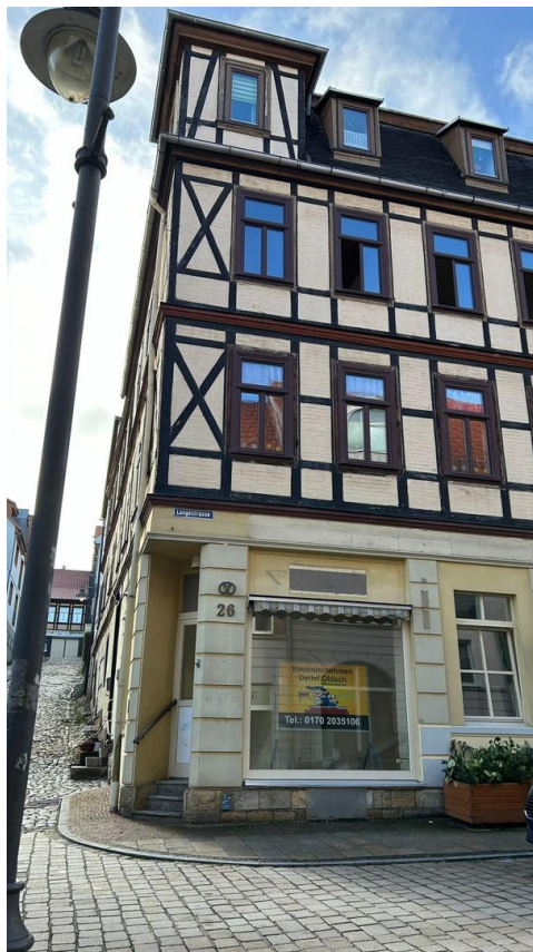
Das Fachwerkhaus Lange Str.