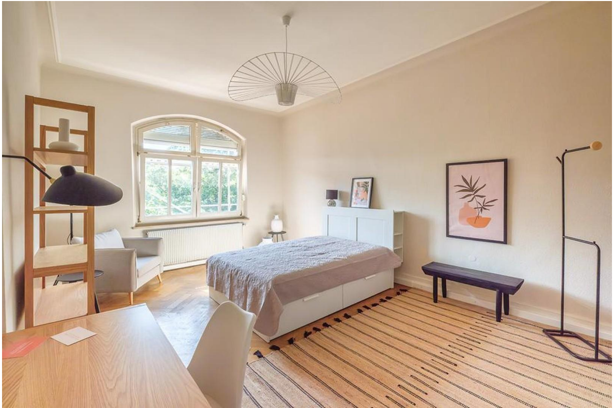
Großzügiges WG-Zimmer 4, 29 qm