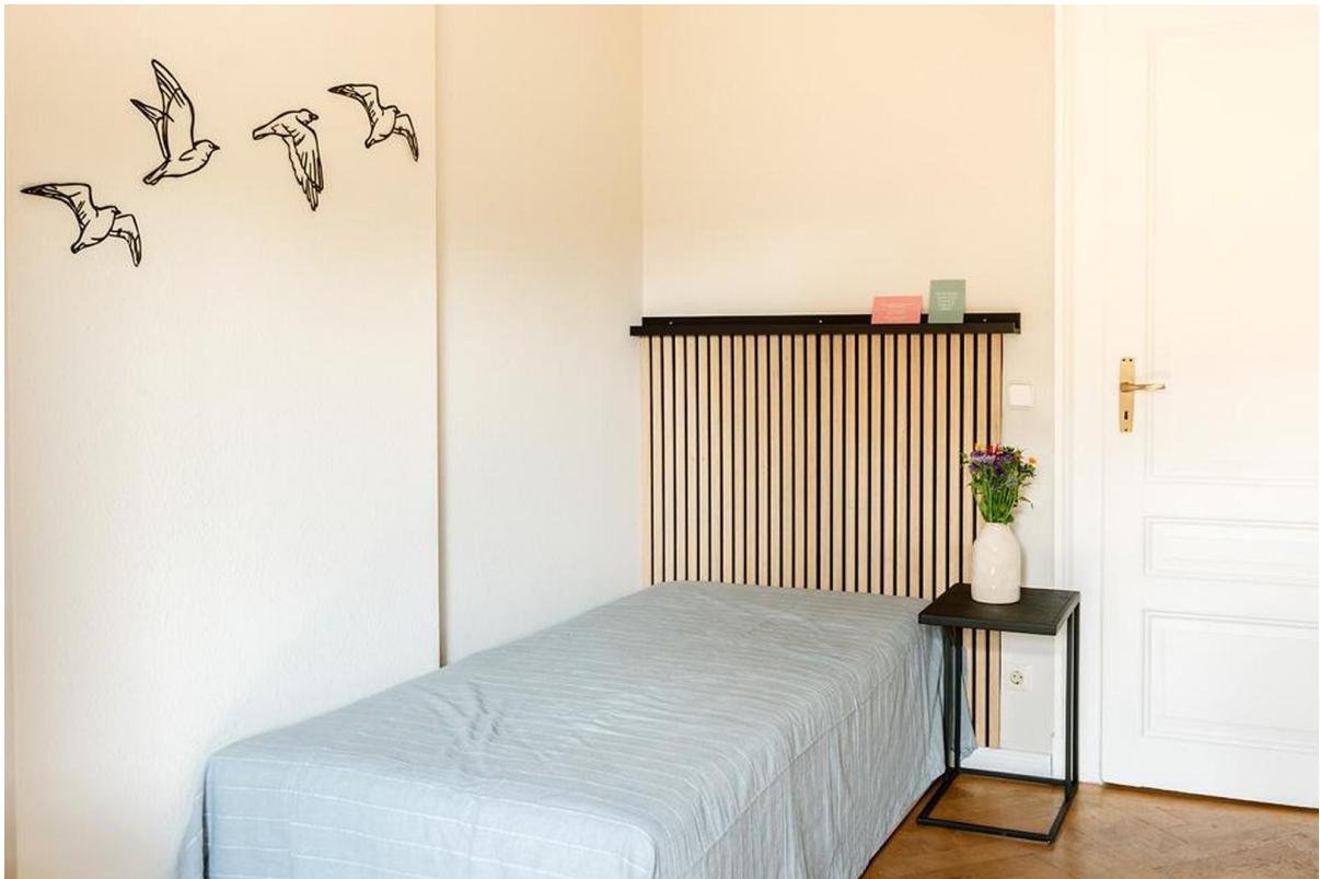
gemütliches WG-Zimmer 3, 16 qm