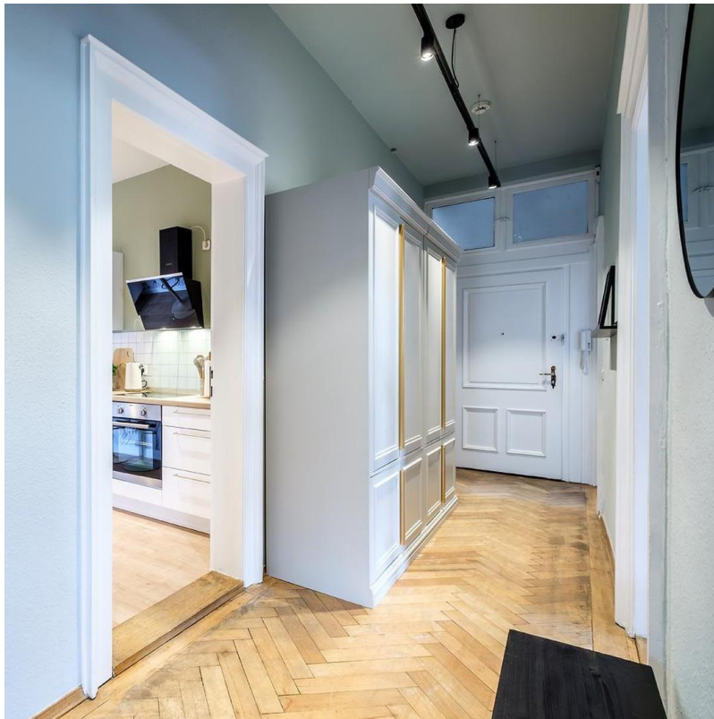
Flur mit Garderobe