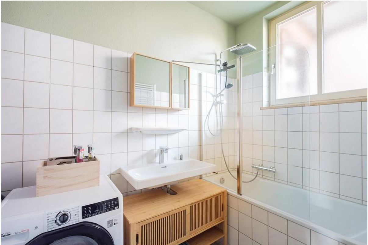
Badezimmer mit Waschtrockner