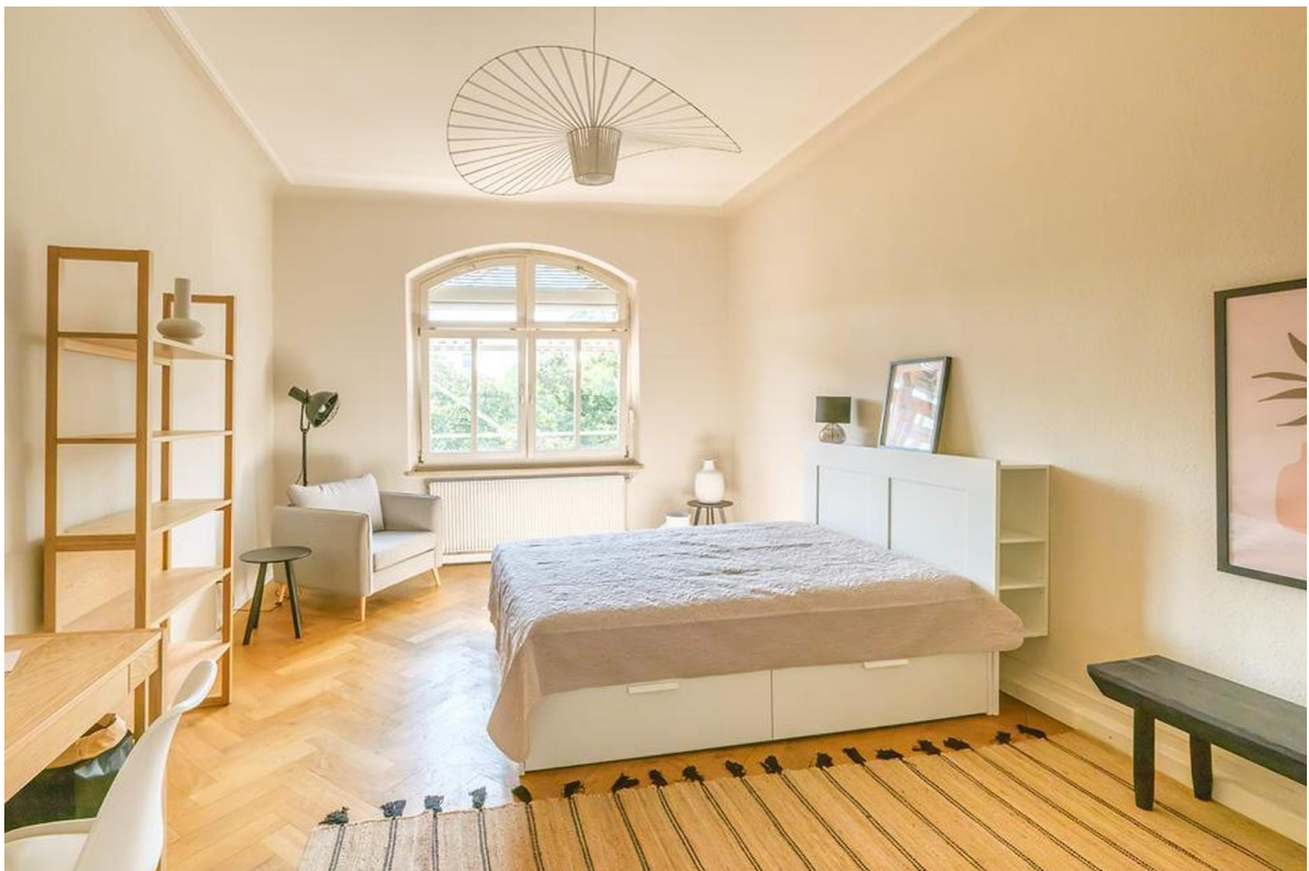
Entspannen und arbeiten