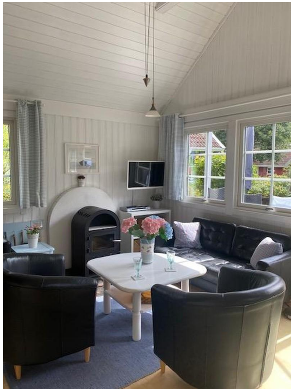
Wohnzimmer mit Kamin