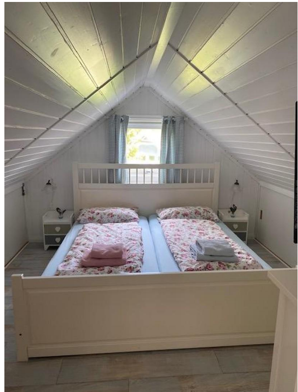
Schlafzimmer im Dachgeschoss