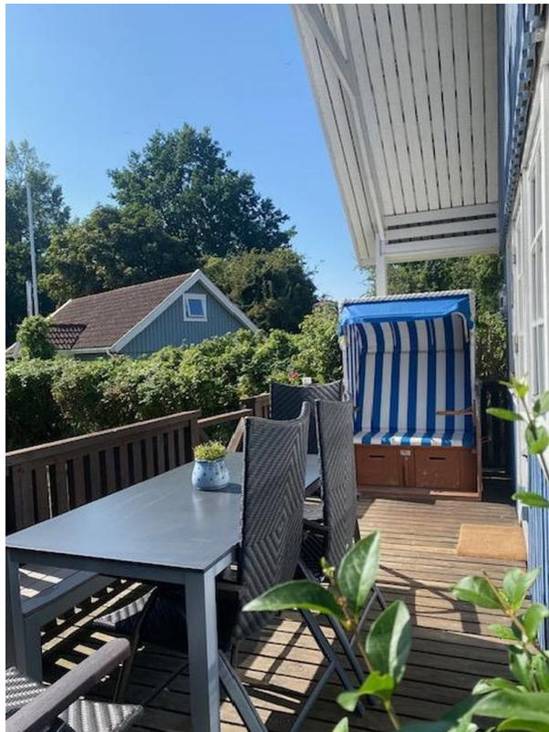
Terrasse mit Strandkorb