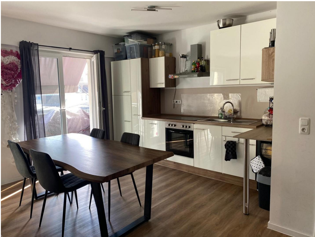
Küche / Esszimmer