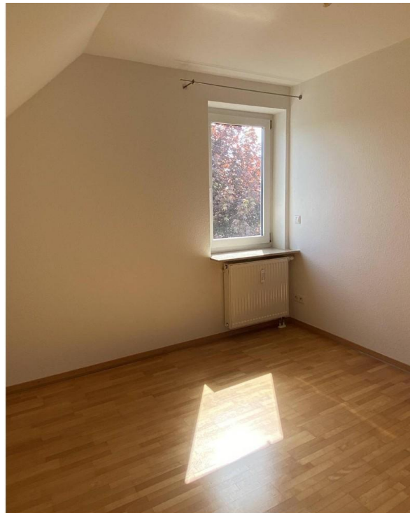
felixbel nutzbares Zimmer