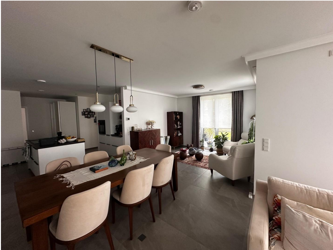
Wohnraum mit Essplatz