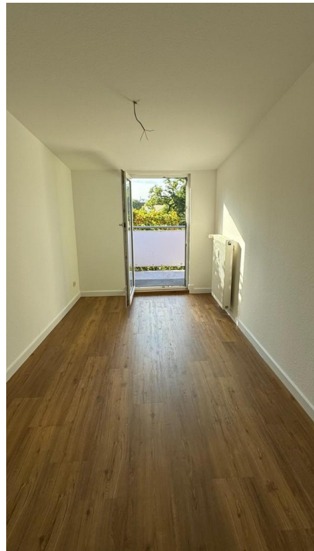
Zimmer zum Balkon