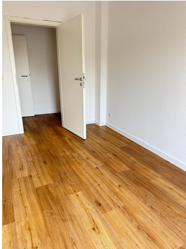
Zimmer zum Balkon