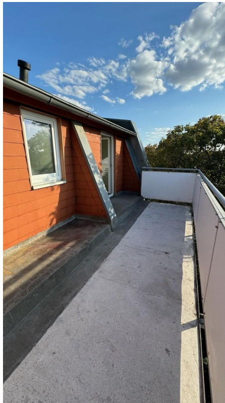
Balkon (noch ohne neuer Beschi)