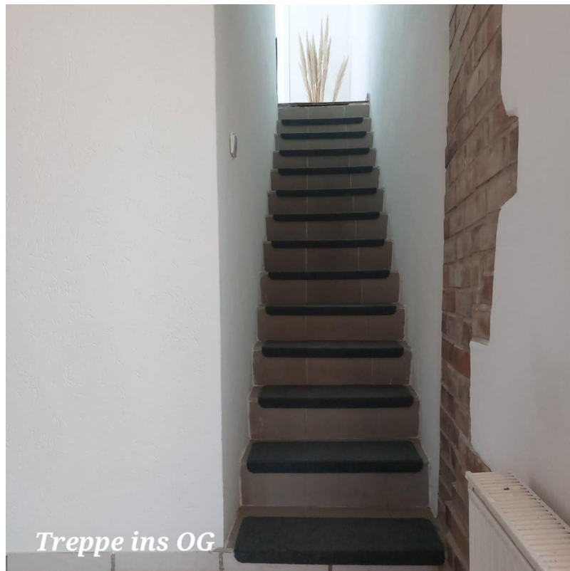
Treppe ins OG