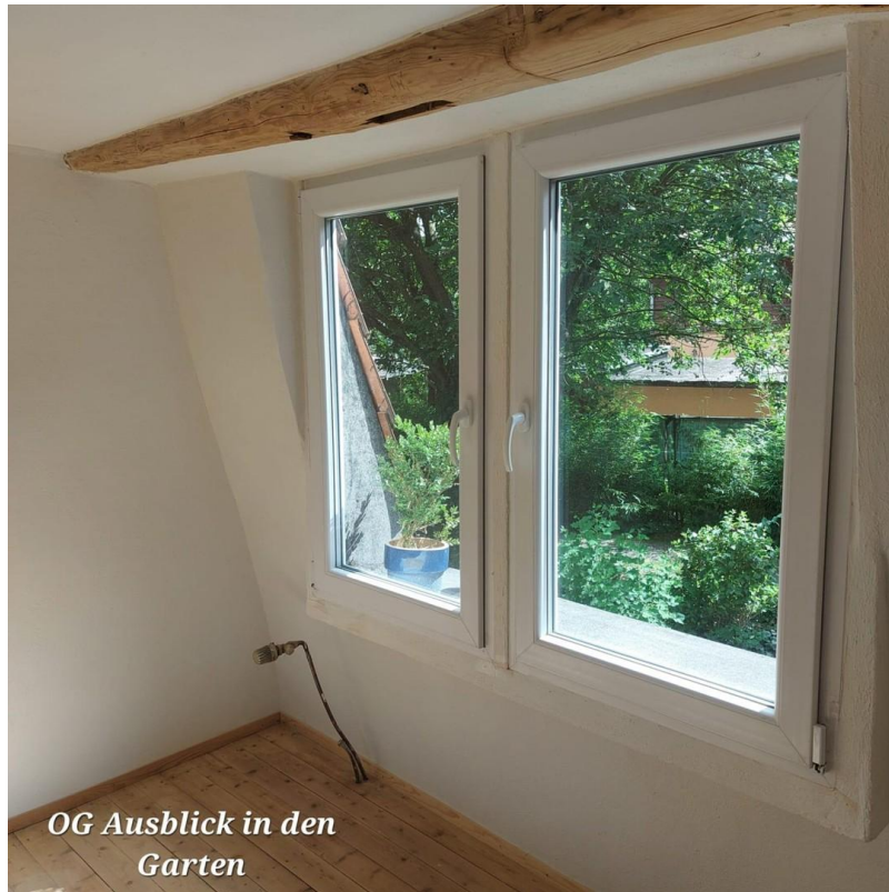
OG Ausblick in den Garten