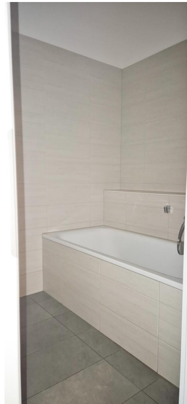
Bad mit Badewanne