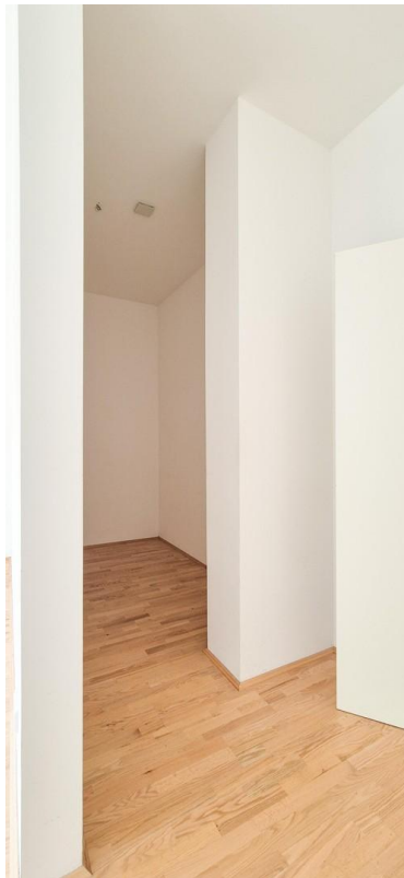
Abstellraum hinter Küche