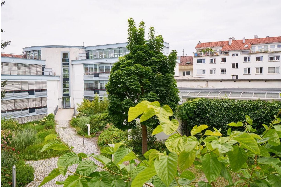
weiter Blick ins Grüne vom Bal