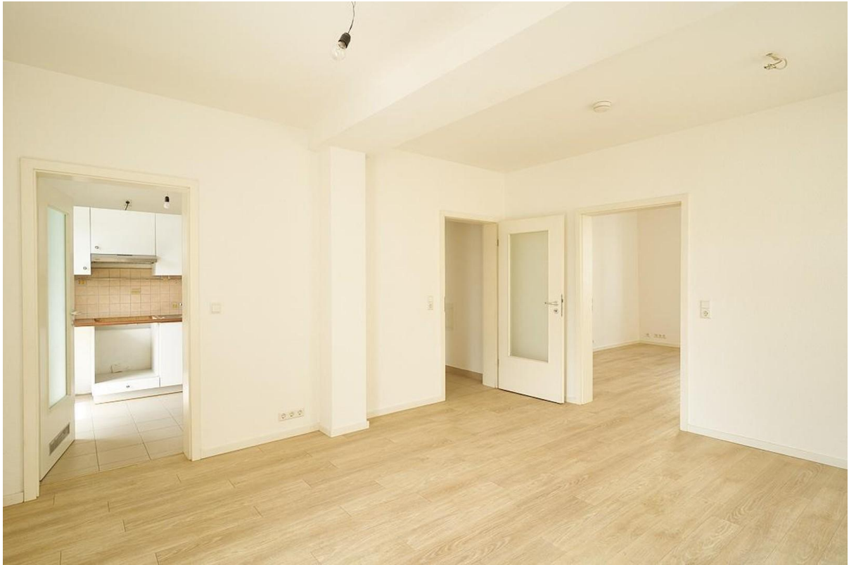
Esszimmer mit Blick zur Küche