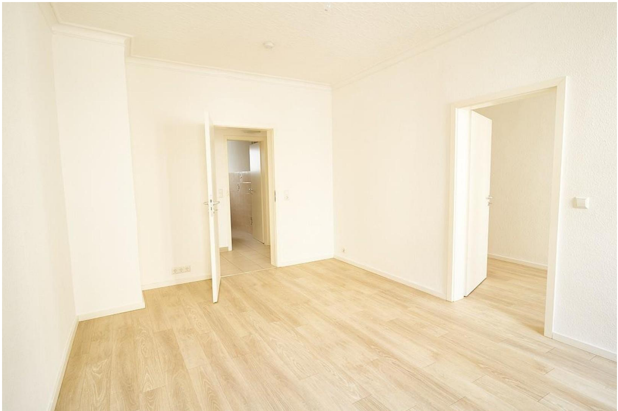
Schlafzimmer mit Ankleide