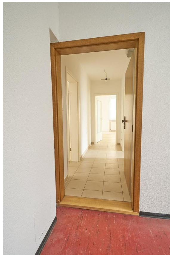
Die Tür zu Ihrer Wohnung