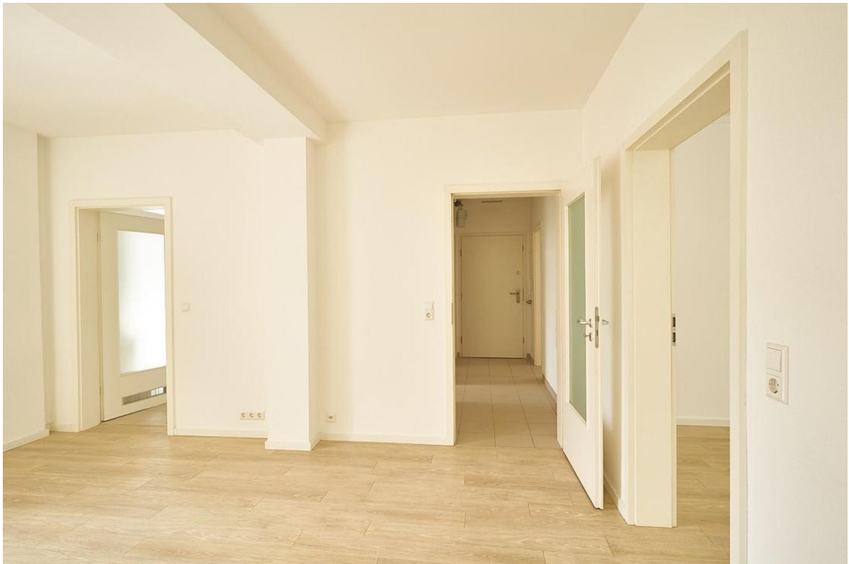
Esszimmer mit Blick zum Flur