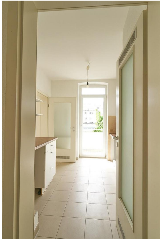
Küche mit Balkon