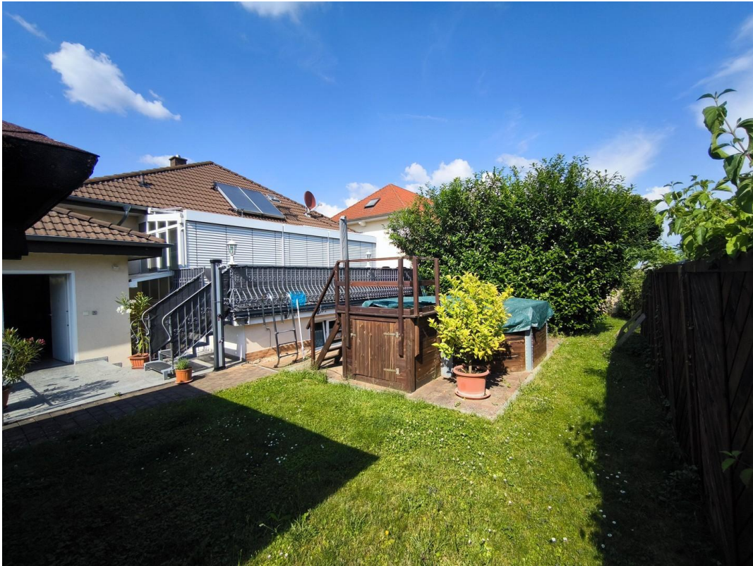
Ansicht Pool, Terrasse