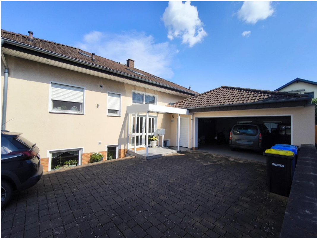
Hof und Doppelgarage