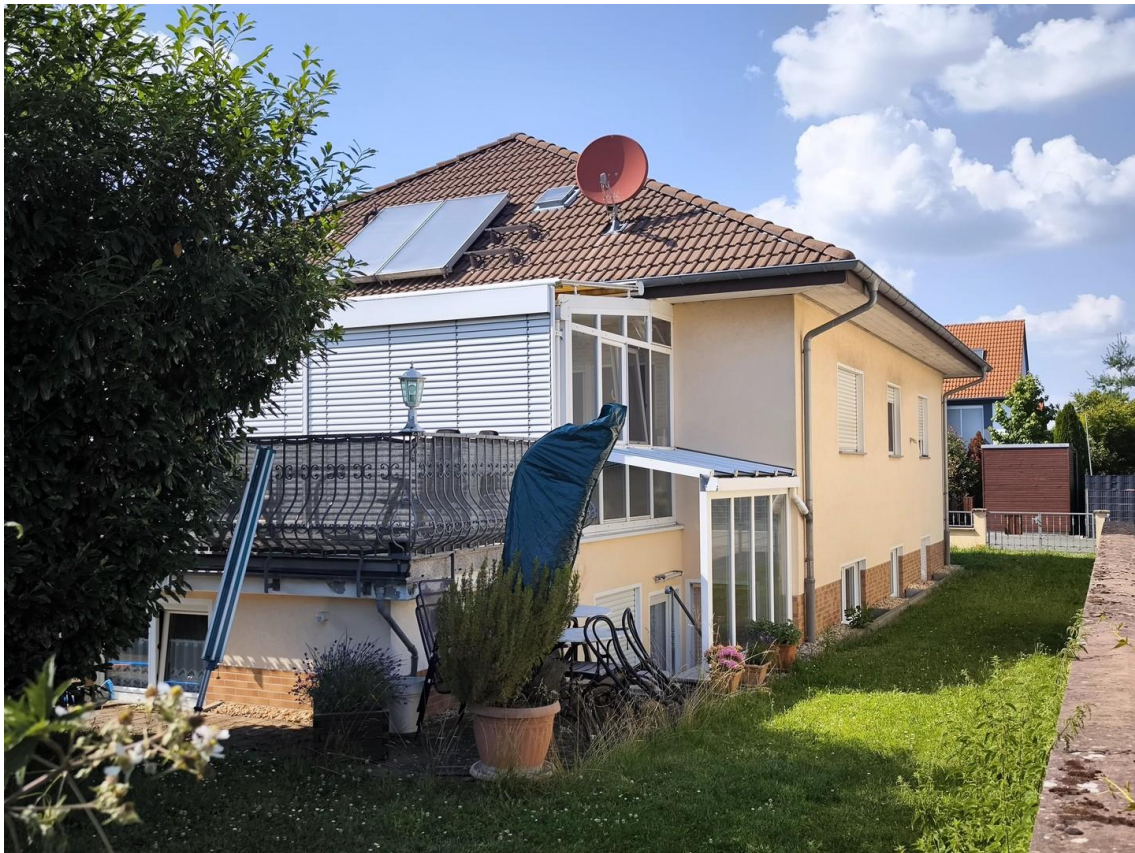
Garten und Wintergarten