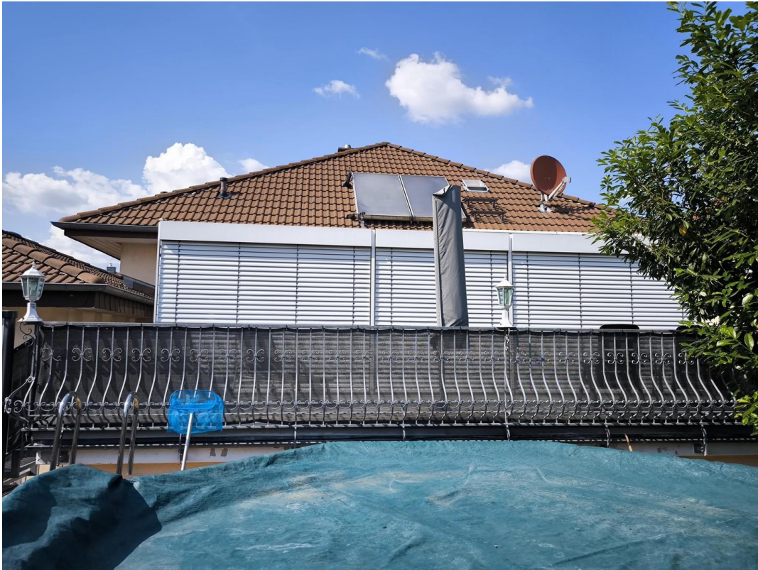
Terrasse imm Garten