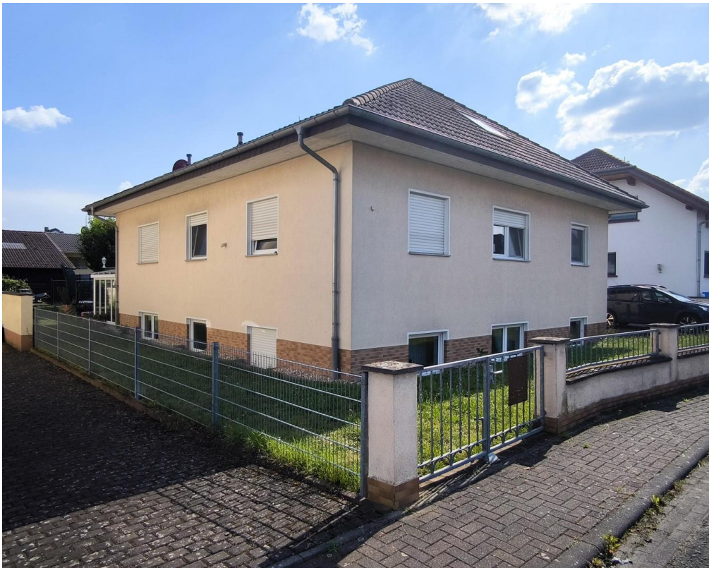
Ansicht zum Garten