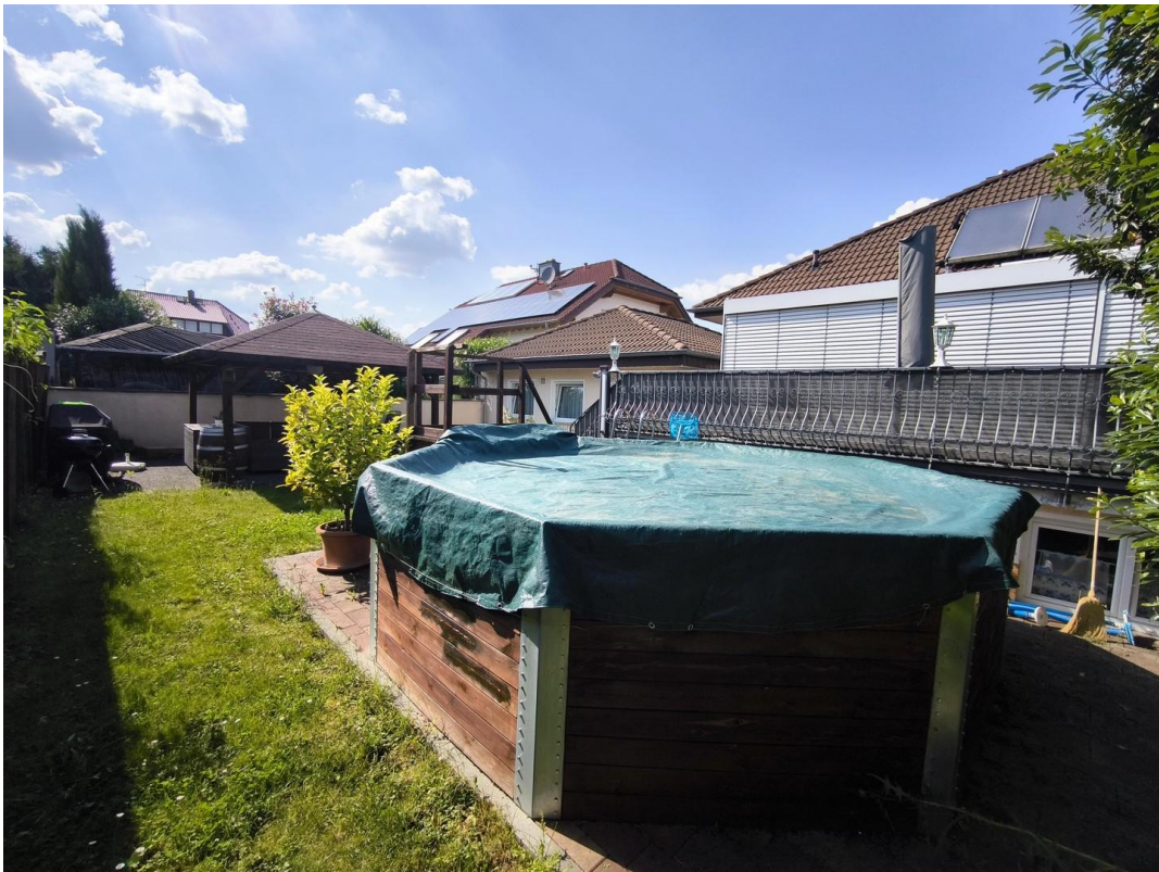
Pool, Loggia, Terrasse