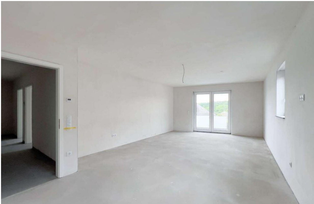
Wohnzimmer 3Zi Wohnung