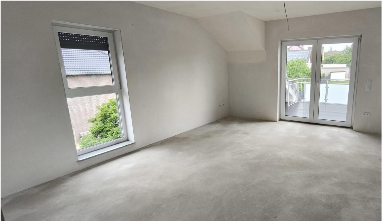
Wohnzimmer einer 2Zi. Whg.