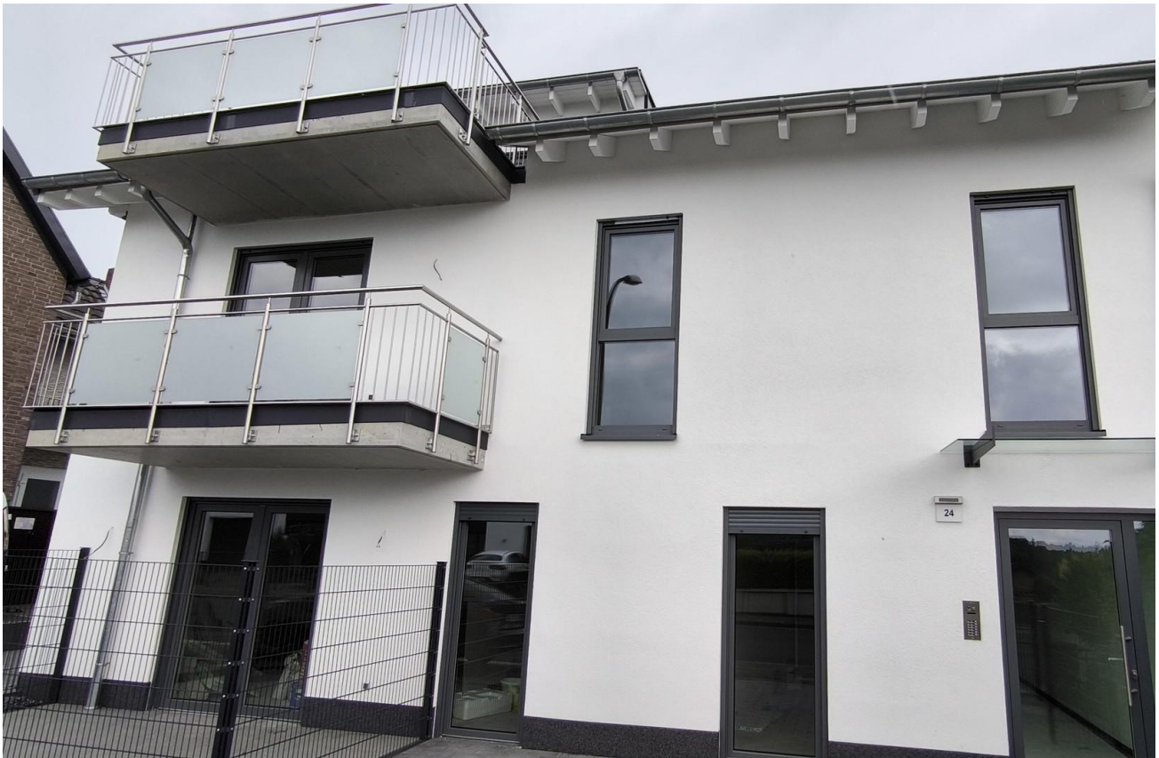
Eingang der Anlage