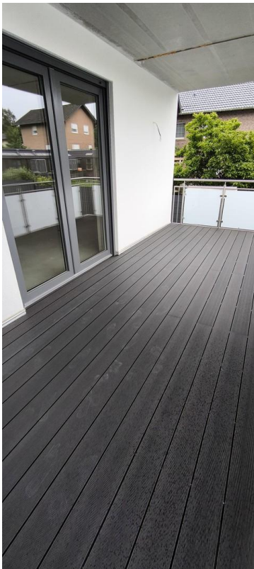
Zugang über Wohn- und Schlafz.