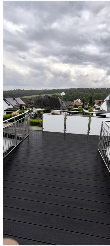
Blick von der Dachterrasse