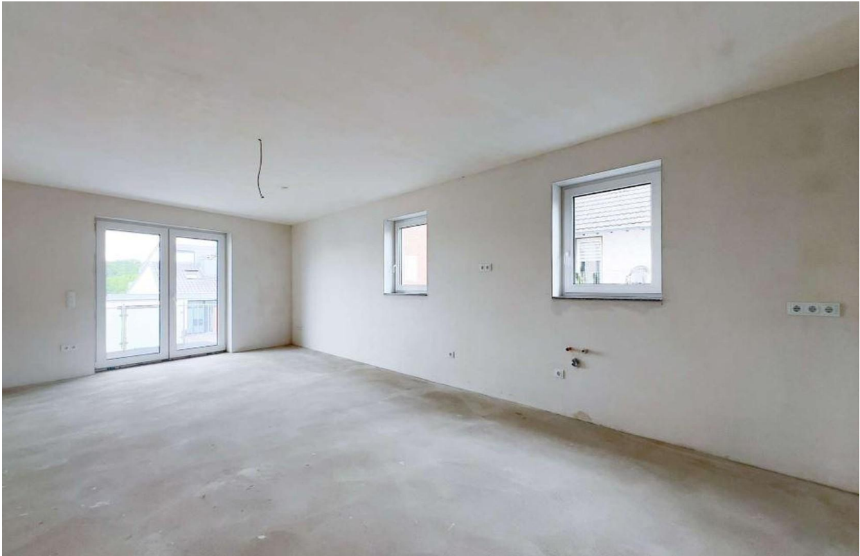
Wohn/-Esszimmer 3Zi Whg