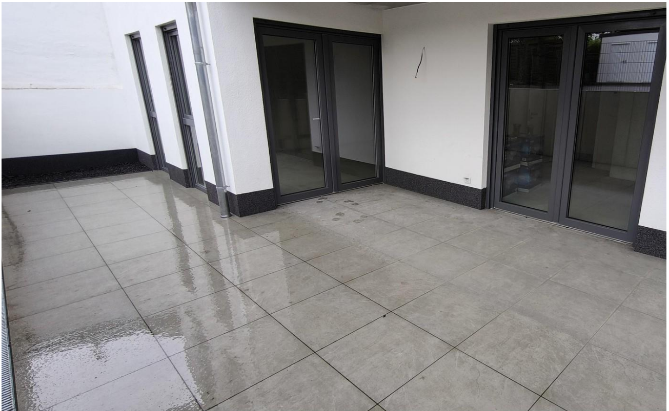
Terrasse im EG.