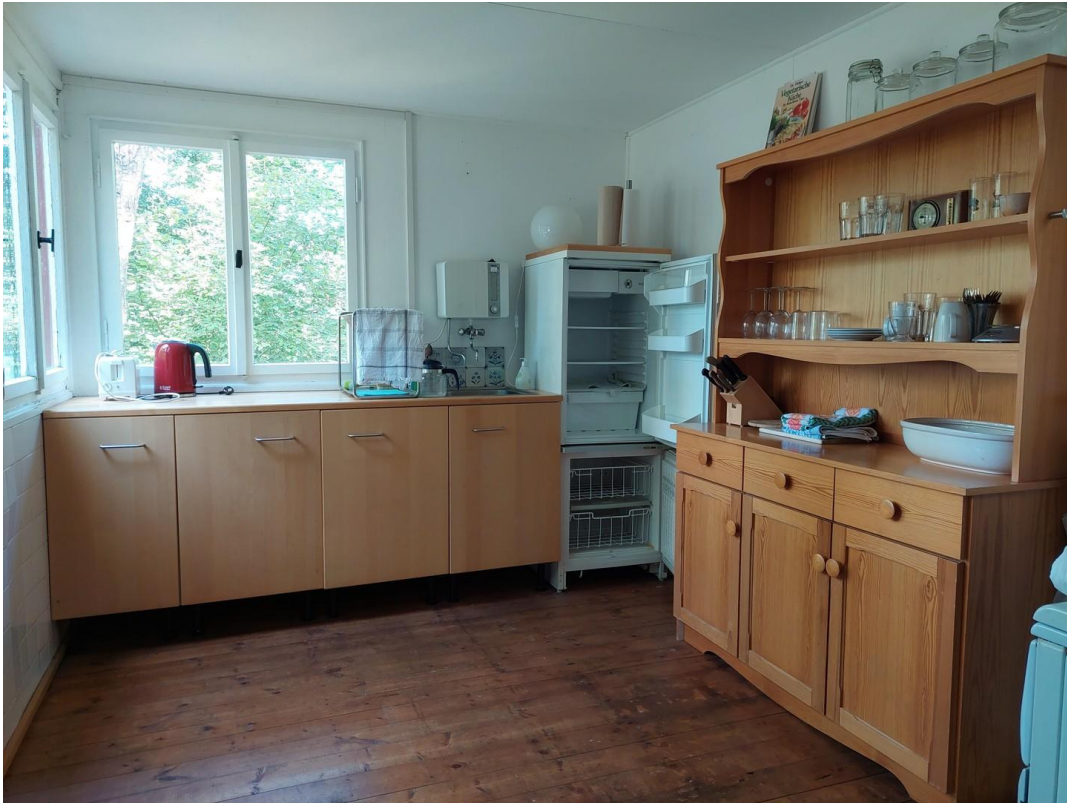
Bungalow 1 Küche Blick 2