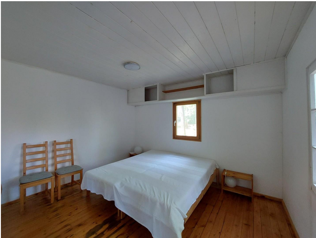
Bungalow 1 Wohnraum Blick 1