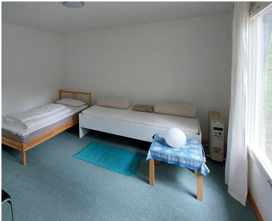
Bungalow 2 Wohnraum