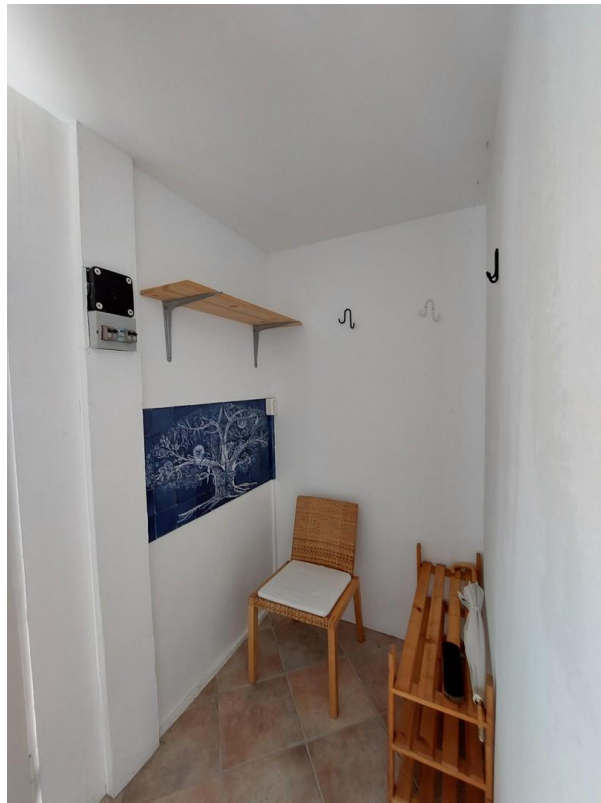
Bungalow 2 Vorraum