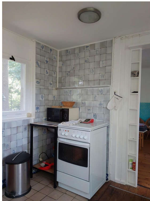
Bungalow 1 Küche Blick1