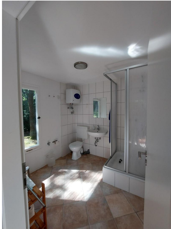
Bungalow 2 WC & Dusche