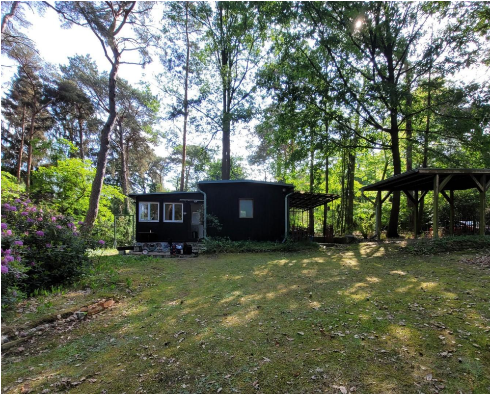
Bungalow 1 mit Carport