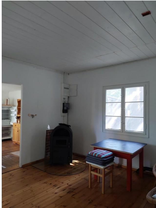
Bungalow 1 Wohnraum Blick 22