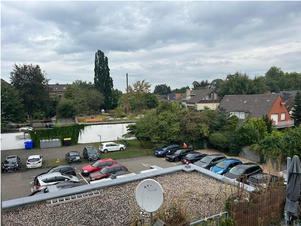
Blick vom Balkon