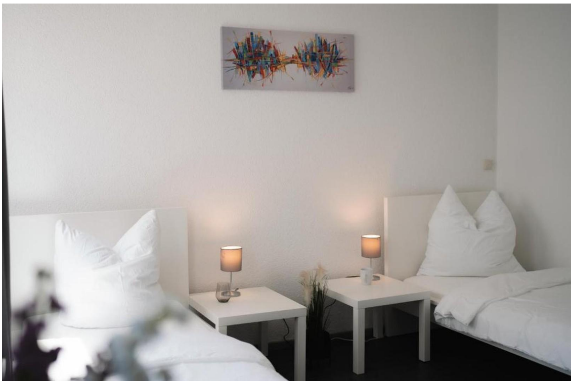
Zimmer mit 2 Betten