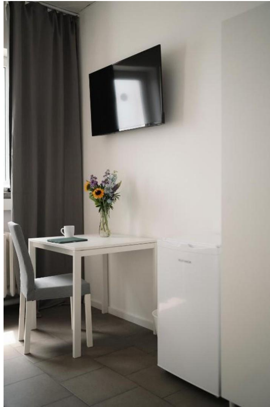
TV und Tisch in Zimmern