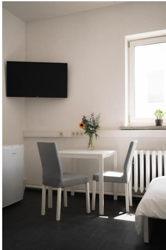
TV und Tisch in Zimmern