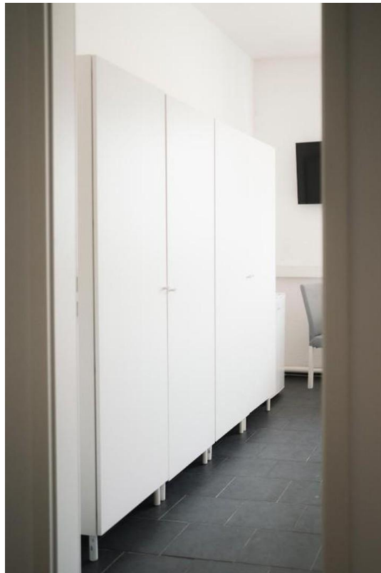
Schränke in Zimmern