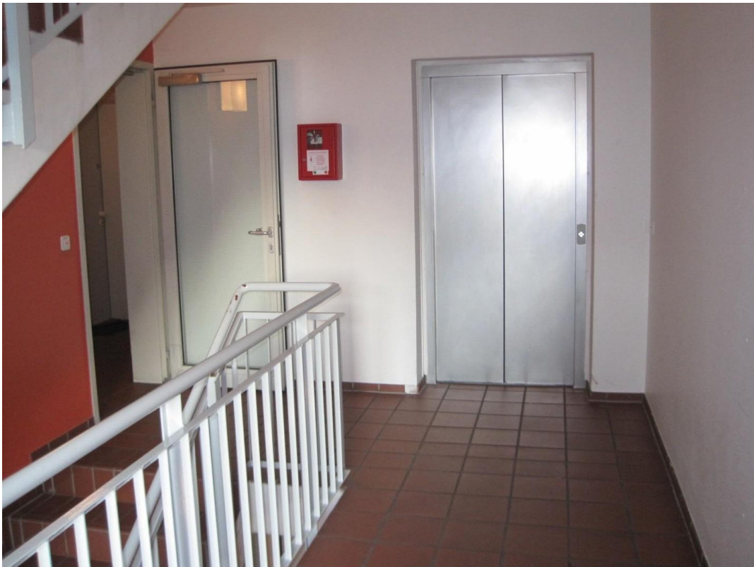
Hausflur mit Fahrstuhl