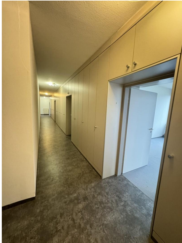
Flur mit Einbauschränken