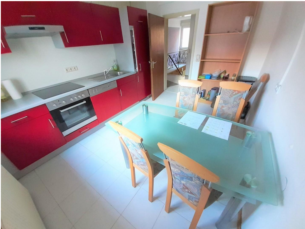
EBK und Essplatz