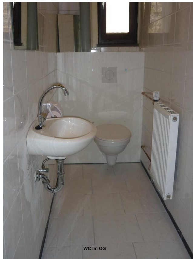
WC im OG