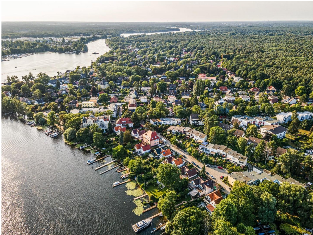
Umgebungsbild Lage 1