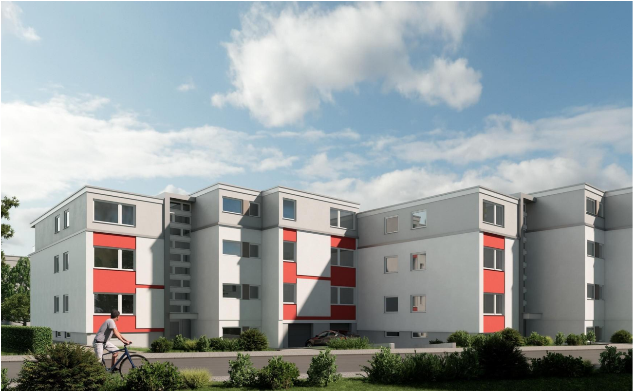
Visualisierung - nur als Idee!