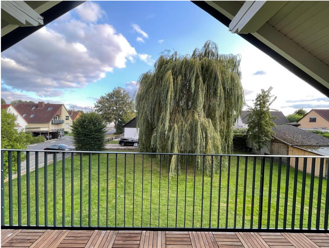
Blick von der Loggia