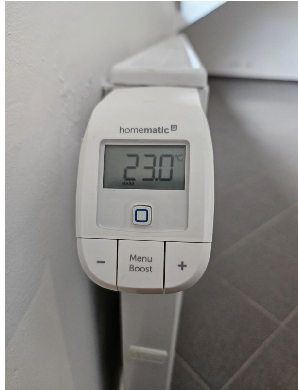
Alle Heizkörper mit Smart Home