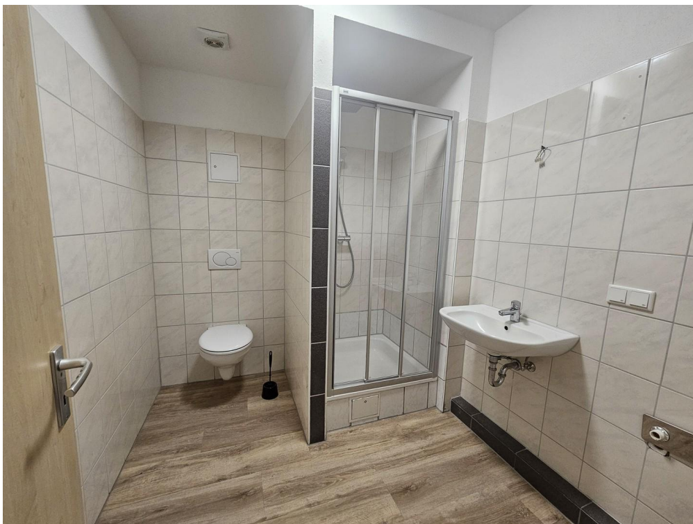
Bad mit Dusche und WC