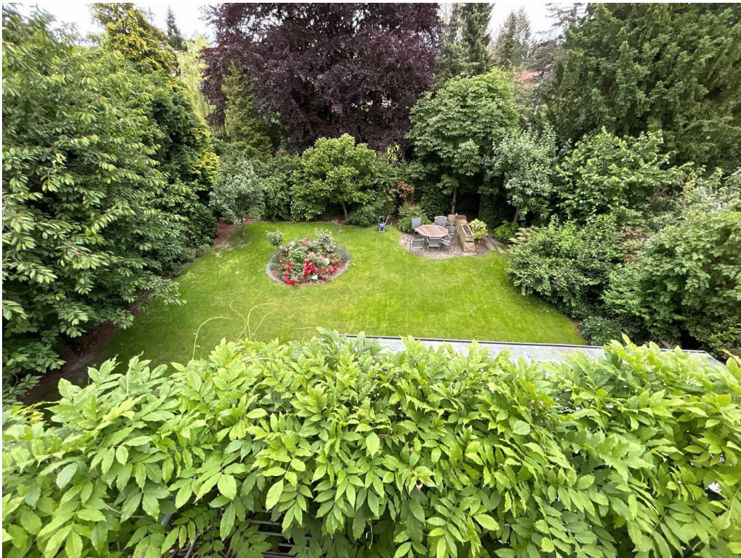
Blick in der Garten