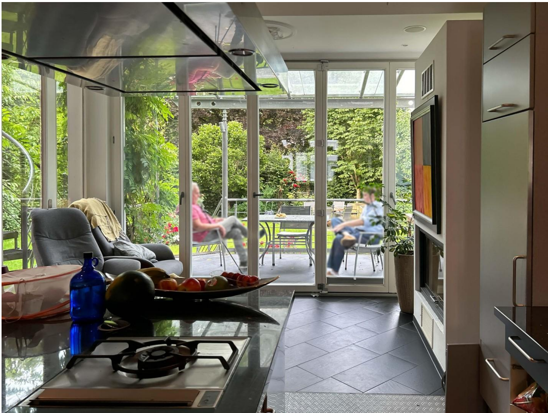
Blick in den Wintergarten