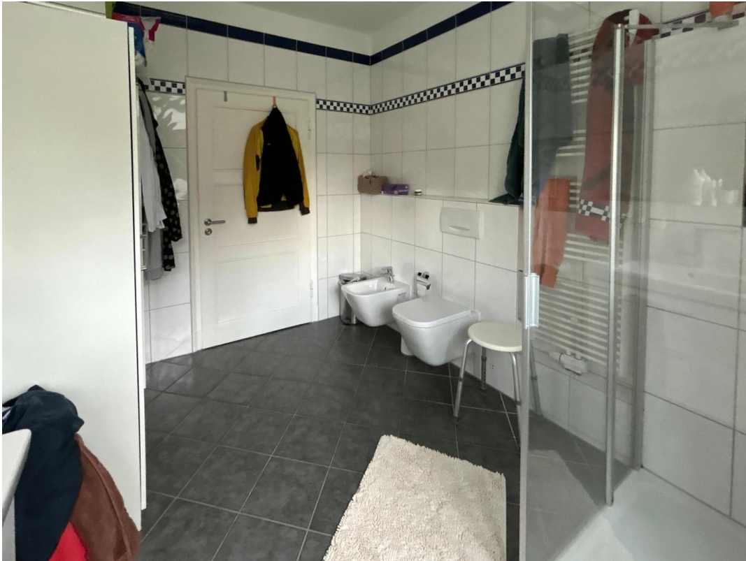
2. Bad 1. OG