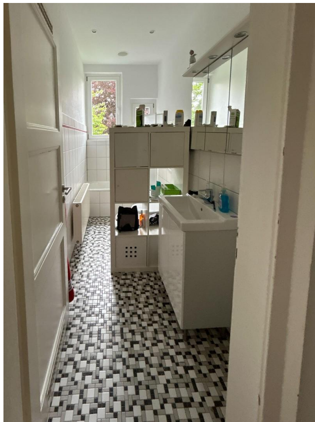
Bad 1. OG