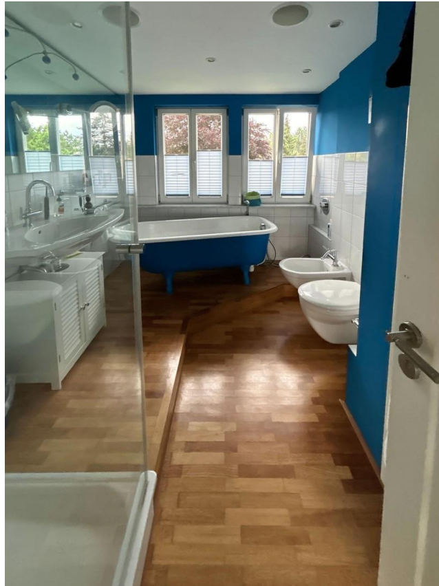
Bad der Penthousewohnung