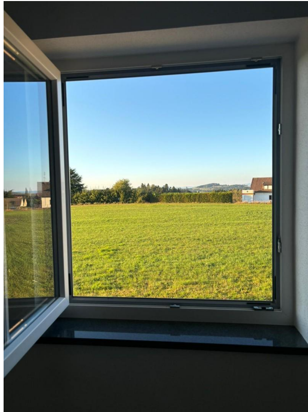
Aussicht Schlafzimmer 1