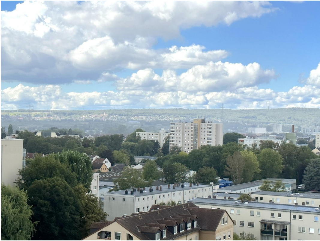
Aussicht von Balkon