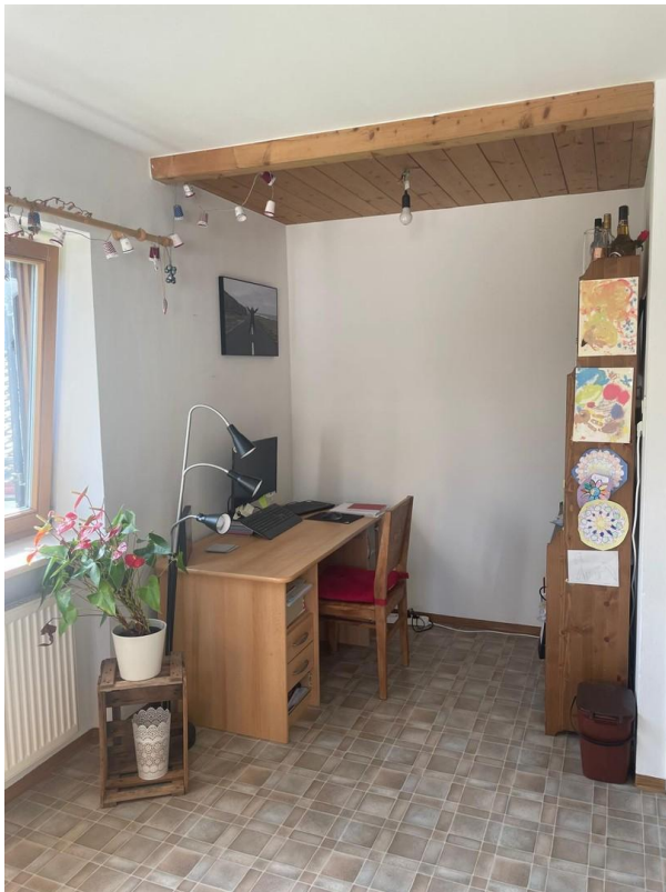
Ess- / Arbeitsecke Wohnküche