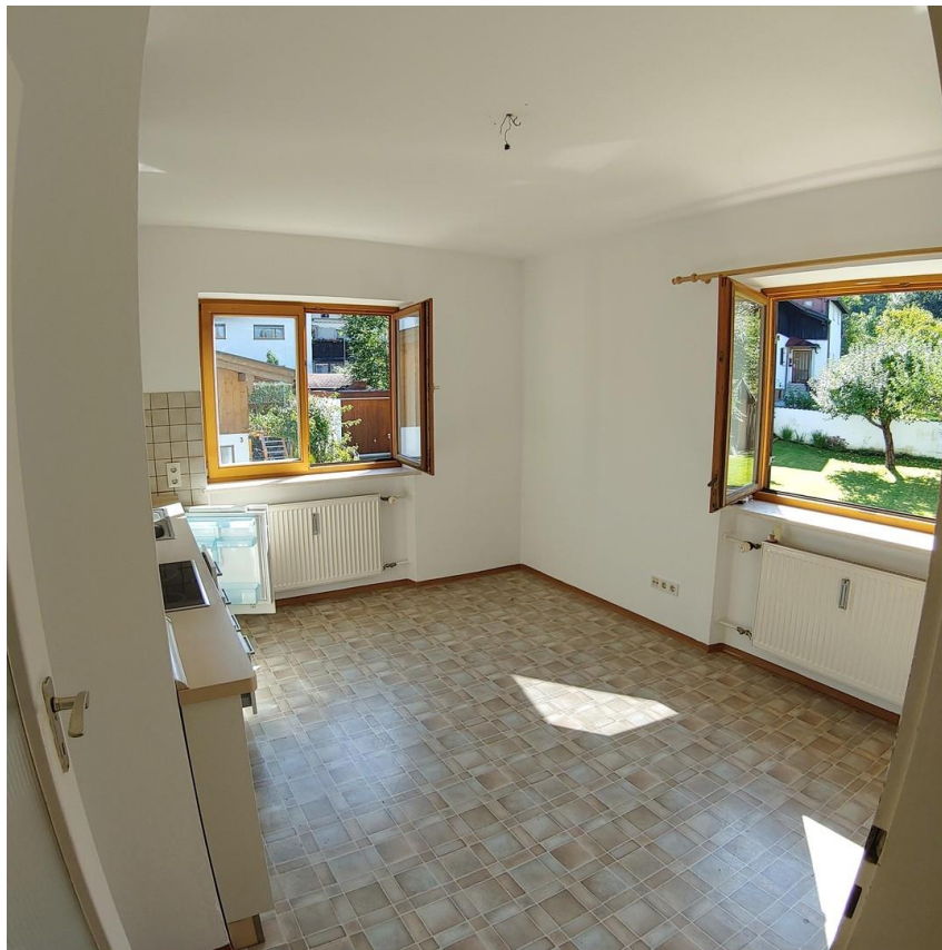
Wohnküche mit Gartenblick