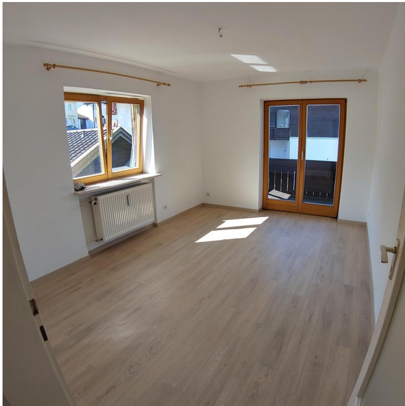
Schlafzimmer mit Westbalkon