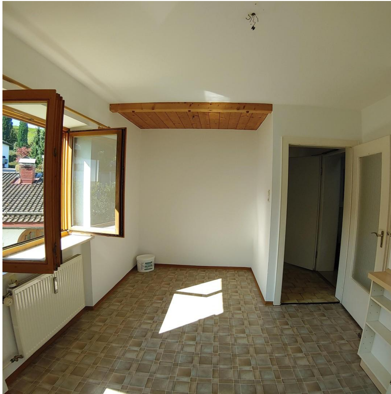
Ess- / Arbeitsecke Wohnküche