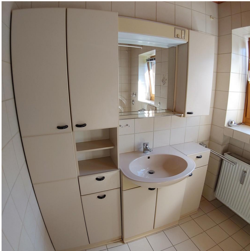
Bad mit Spiegelschrank