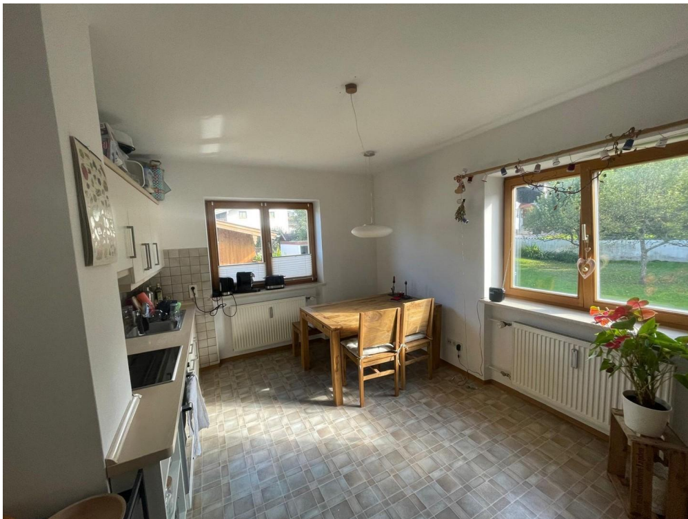
Wohnküche mit Gartenblick