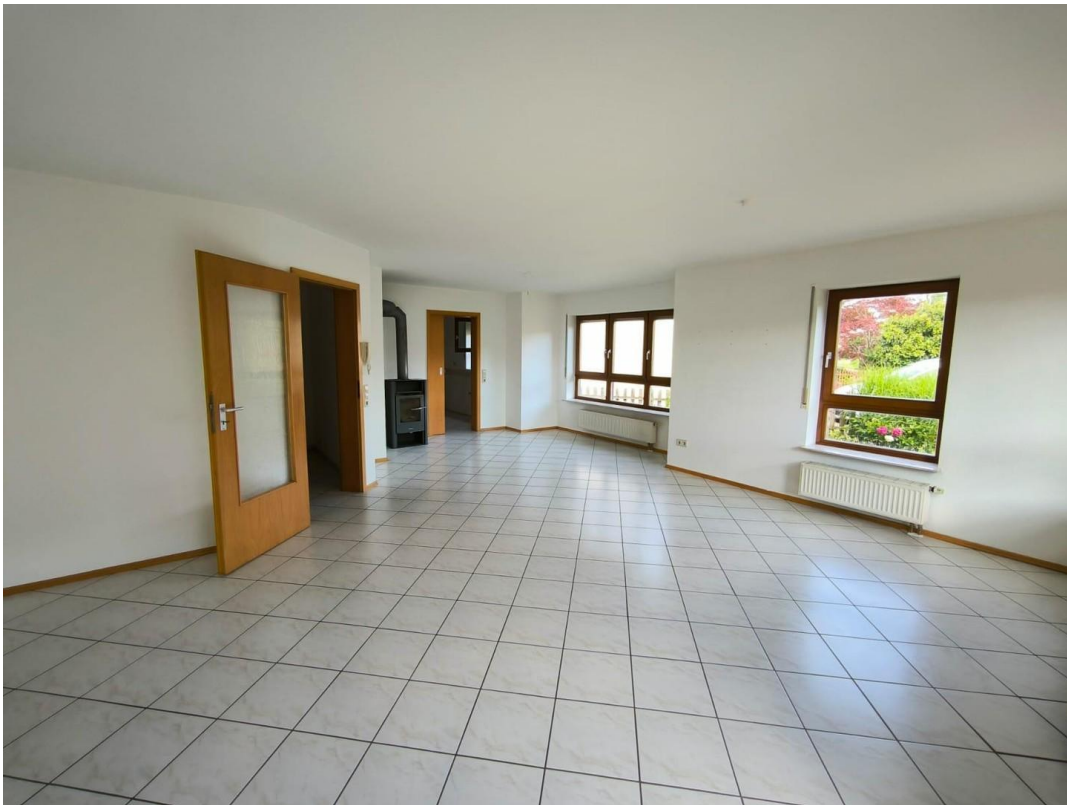
Wohn- und Essbereich