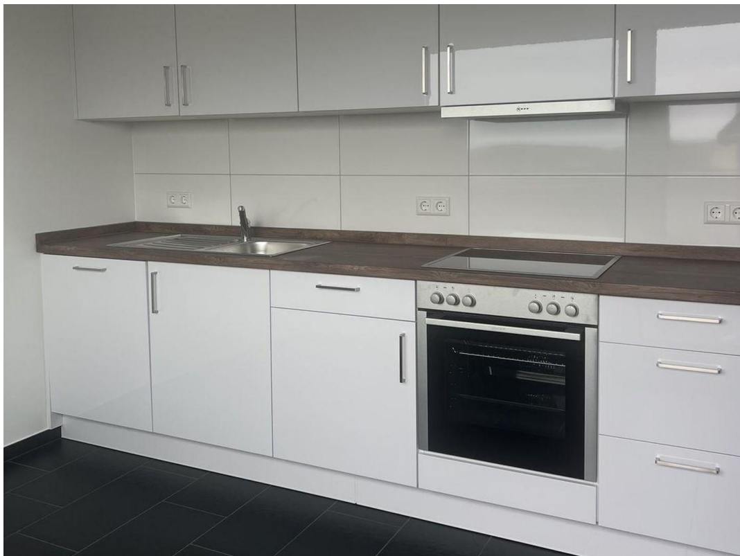
Küche Wohnung II - Grimm Küche