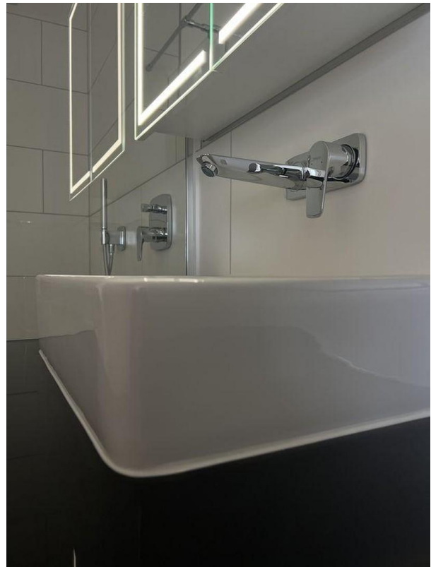
Badezimmer Wohnung II