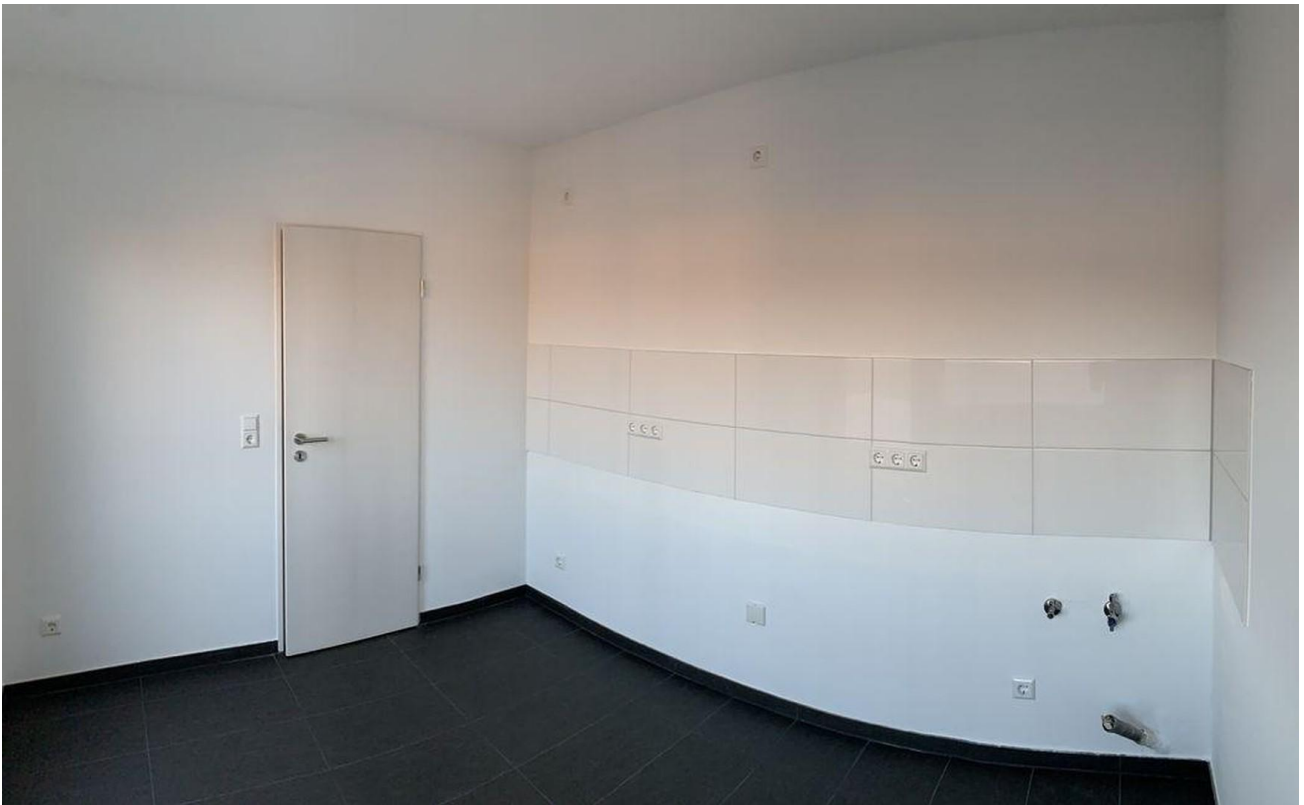
Küche Wohnung I