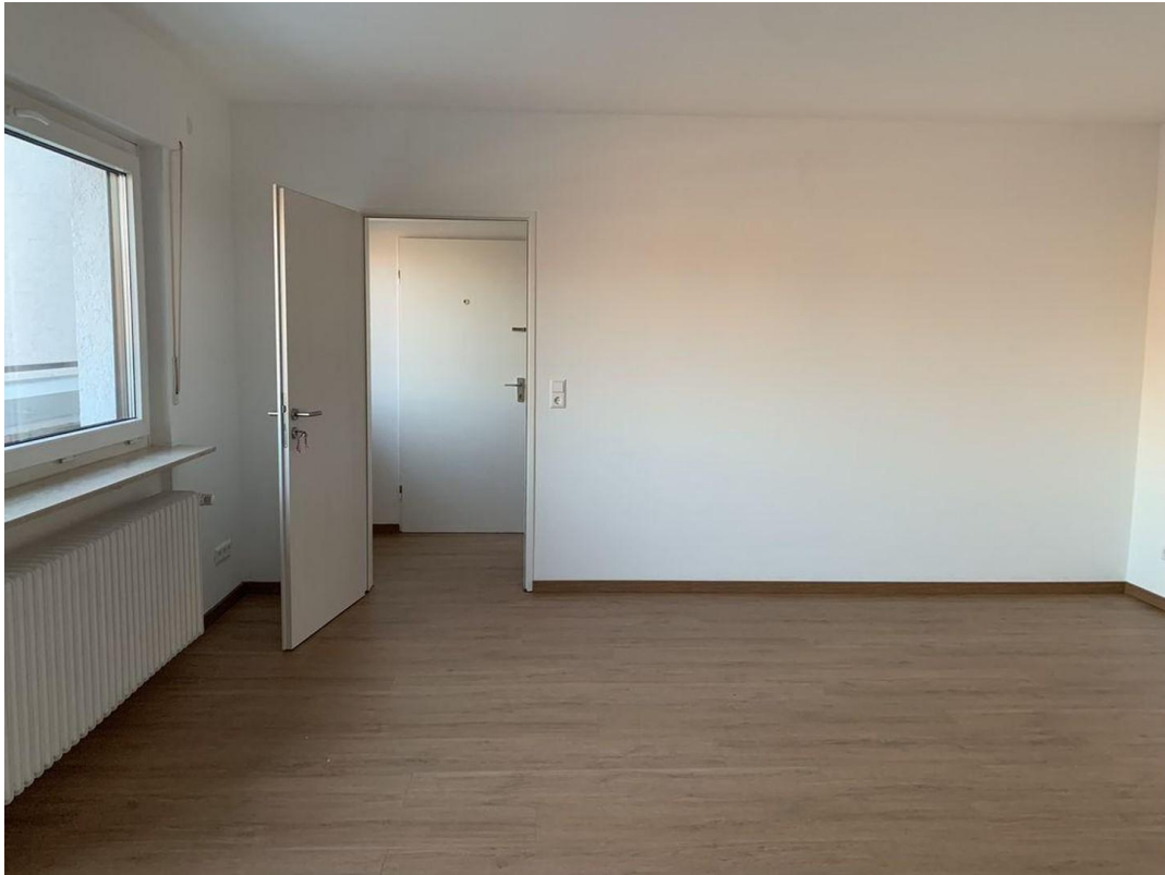
Wohnraum Wohnung I