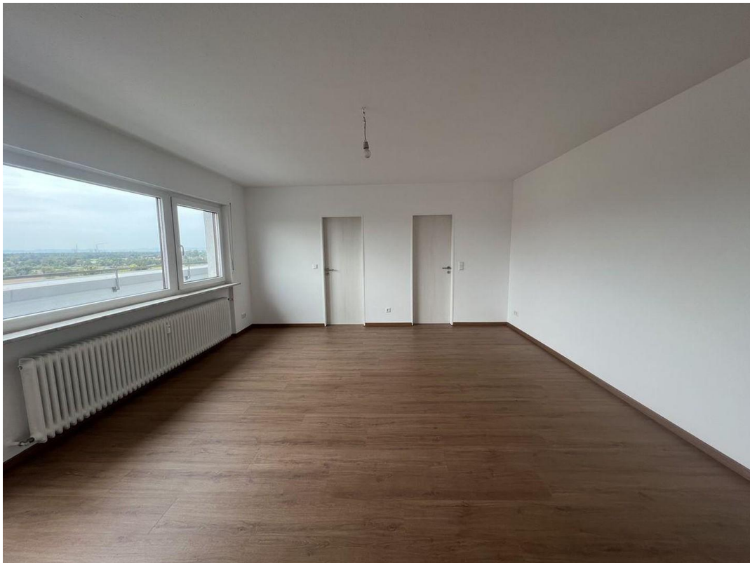
Wohnraum Wohnung II