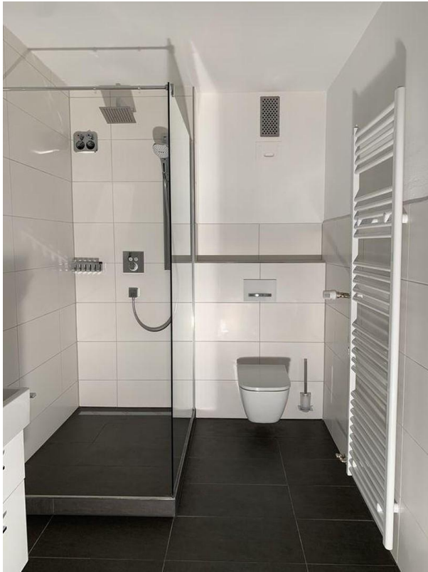
Badezimmer Wohnung I