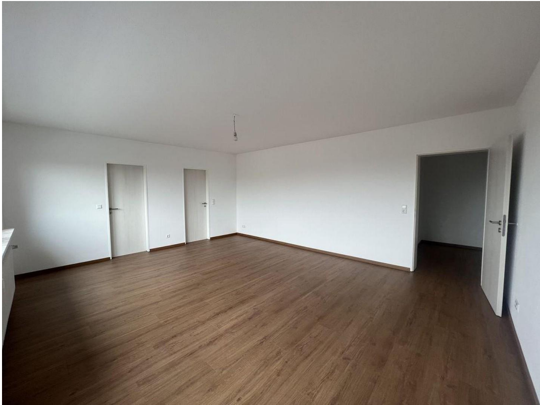
Wohnraum Wohnung II