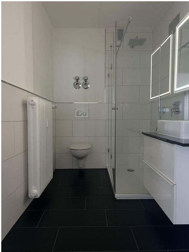
Badezimmer Wohnung II