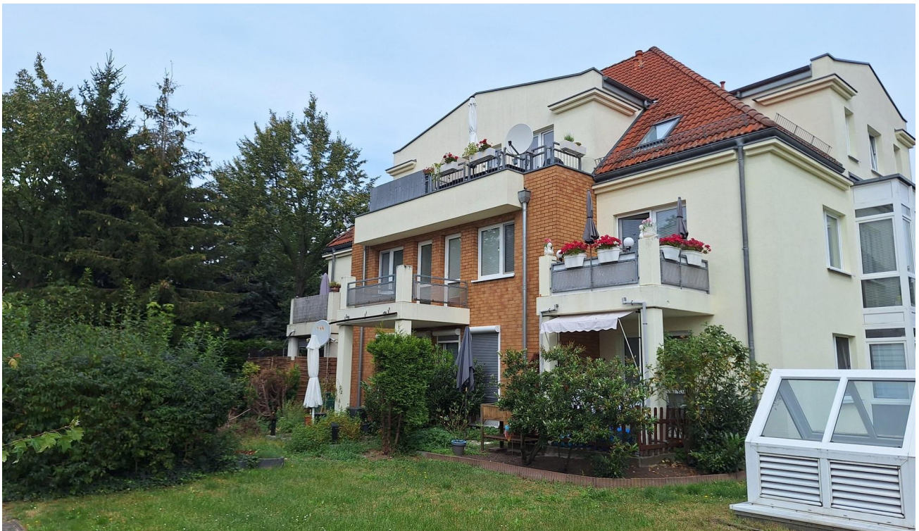
Außenansicht 1.OG Mitte